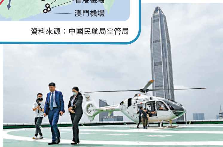
▲去年3月，深圳開通機場到市區空中快線，乘客前往深圳福田區只需10分鐘。資料圖片