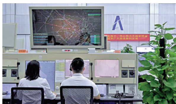
▲中南空管局廣州區域管制中心指揮班機沿着全新的京廣大通道有序飛行。

值得一提的是，今次京廣大通道在華北地區調整京津冀各機場往深珠澳等機場方向的班機走向，通過截彎取直，使北京首都機場至港、深、珠、澳的航班單程可節省約125公里，全年可節省318萬公里里程，節省燃油約1.7萬噸，減少碳排放約5.4萬噸。另外，還新增一條北京大興機場往廣