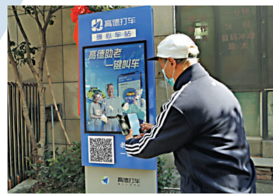
▲在浙江杭州助老「一鍵叫車」暖心車站前，老人掃碼叫車。