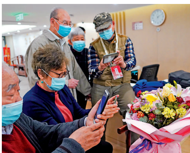
▲在北京首厚大家朝陽養老社區，老人們參加手機攝影課。

臉靠近攝像頭，跟着屏幕提示眨眨眼睛，念出指定數字，70多歲的黃達智頗為熟練地在深圳家中用手機人臉識別，就可以登錄上老家廣西的社保系統。用智能手機線上辦事，年輕人動手就能完成，但黃達智這樣的「銀髮族」卻要花費不少精力才能學會。如今，幫助老年人學會使用智能手機，樂享數字生活，已成為各界關注的焦點。在深圳市和浙江省，通過社區開課「速成」，推出帶有快捷功能的極簡型「長輩專供」APP等暖心妙計，銀髮一族也可跨越數字鴻溝，暢遊網絡。