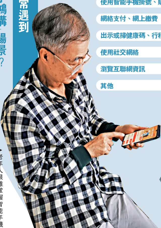
數據來源：新華網網民調查 大公報整理