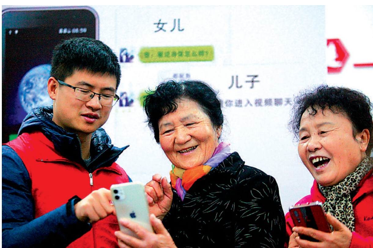
▲在揚州市文匯街道春江社區，志願者在教老年人使用智能手機。

這是該社區舉行的第五次智能手機培訓，社工和志願者向老人介紹了智能手機的操作系統和基本知識，還教會他們如何上微信、搶發紅包、發布朋友圈、投票、點讚。據悉，這樣的「培訓班」在深圳許多社區均有開展。此外，深圳市老齡服務事業產業聯合會（簡稱「深老聯」）亦組建了志願服務隊開展「智慧助老公益行動」，教會老人用手機溝通、就醫掛號、打車、買菜、訂餐。