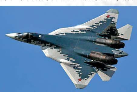
▲蘇-57作為俄羅斯最新型隱形戰機，參與了俄羅斯的特別軍事行動。資料圖片

自2010年首次試飛成功後，蘇-57迄今已生產出12架樣機，其中10架已成功試飛。2018年3月，2架原型機被派往敘利亞西北部的赫梅米姆空軍基地，據悉已經進行了現場測試。2019年12月24日，1架蘇-57在俄羅斯阿穆爾河畔共青城郊外墜毀，飛行員彈射逃生。俄羅斯國防部透露，截至2022年5月，已有3架蘇-57在俄羅斯空軍服役，預計在2024年以前將裝備22架。