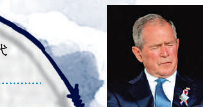
▲美國前總統小布希2003年發動伊拉克戰爭，造成超過25萬名伊拉克平民死亡。