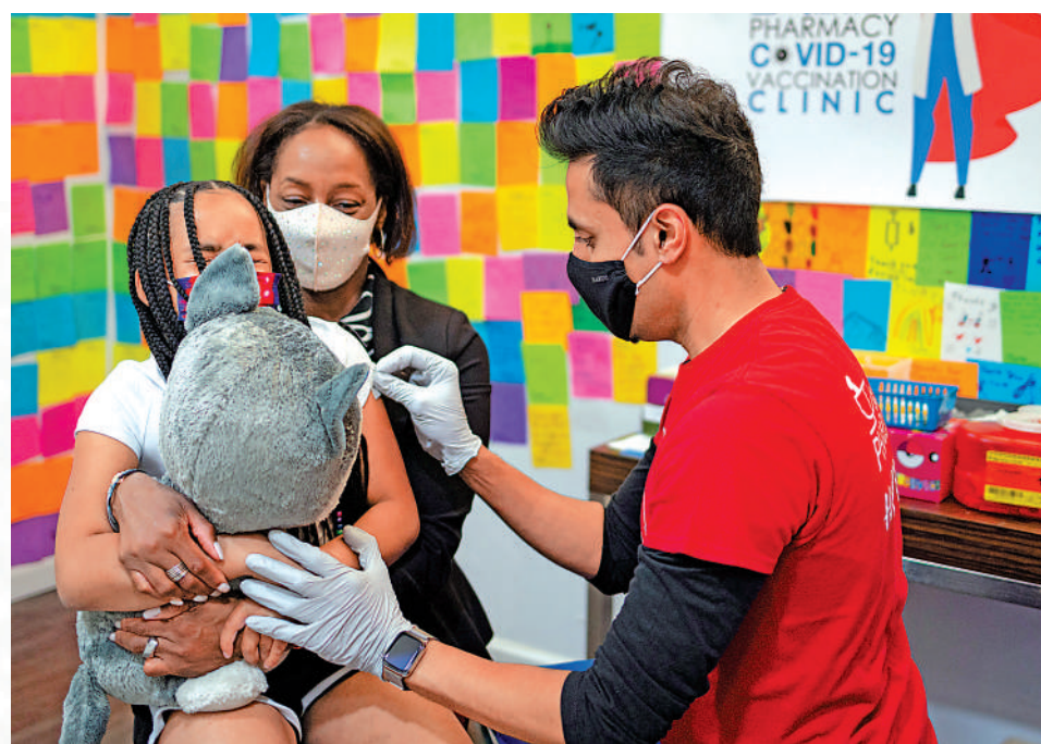
▲美國單日確診人數再次突破十萬，但國會新冠撥款遲遲未有下文，圖為一名8歲美國女童接種疫苗加強劑。