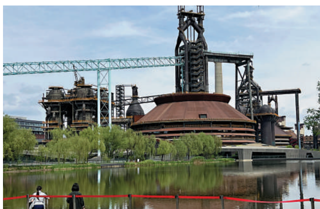
▲首鋼園裏遠望三高爐和秀池，改造後建成綠色休閒公園。

記者了解到，在今年1月文化和旅遊部公布的首批國家級滑雪旅遊度假地名單中，延慶海坨山位列其中。預計2022年至2023年雪季，延慶海坨山滑雪旅遊度假地不僅能夠觀看賽事，還可以在新建的22萬平米大眾雪場挑戰自我，到萬科石京龍滑雪場的初、中、高級10條雪道中任意飛馳，感受雪上風馳電掣的速度與激情。未來，延慶奧林匹克園區還將實現四季運營，繼續承辦冬季體育賽事，為專業訓練和大眾滑雪提供場地。