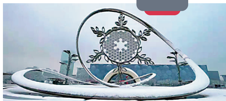
▲國家體育場前的「雪花」火炬台被保留下來，並成為永久性雕塑，傳遞奧運精神。

據張家口市官方發布的「十四五」體育文化旅遊發展實施方案預計，到2025年，張家口冬奧場館將實現可持續高效利用，帶動區域經濟快速發展。