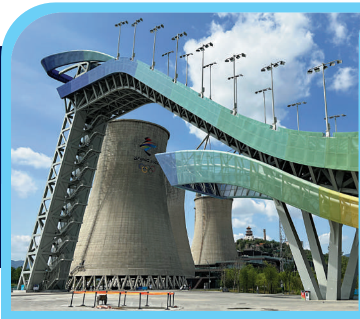
▲滑雪大跳台及其背後的一排工業冷卻塔，備受攝影愛好者追捧。