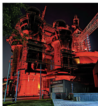
▲在紅色燈光襯托下，百餘米高的「三高爐」彷彿一爐正在冶煉的鐵水，莊重、威嚴而有氣勢。