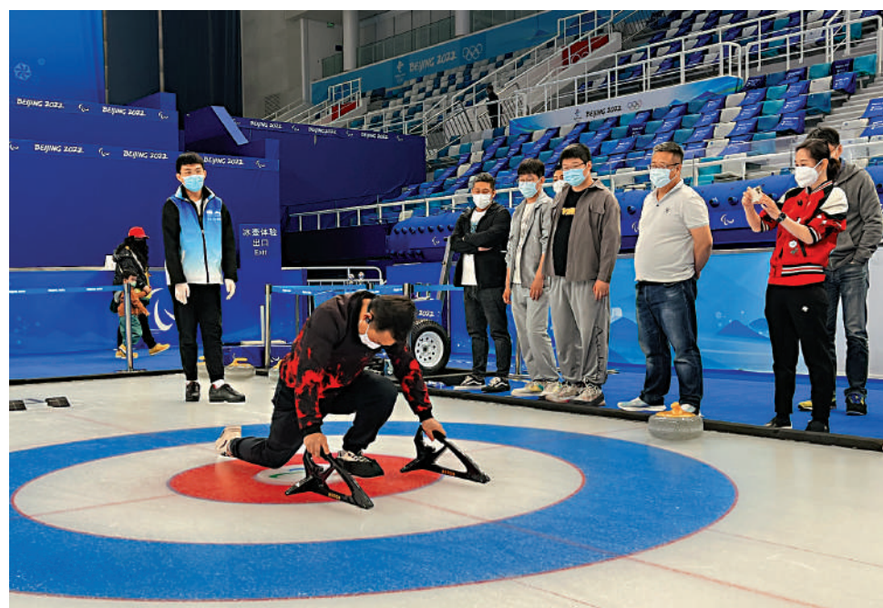
▲遊客在真冰賽道上體驗冰壺運動，專業教練在現場講解、示範。