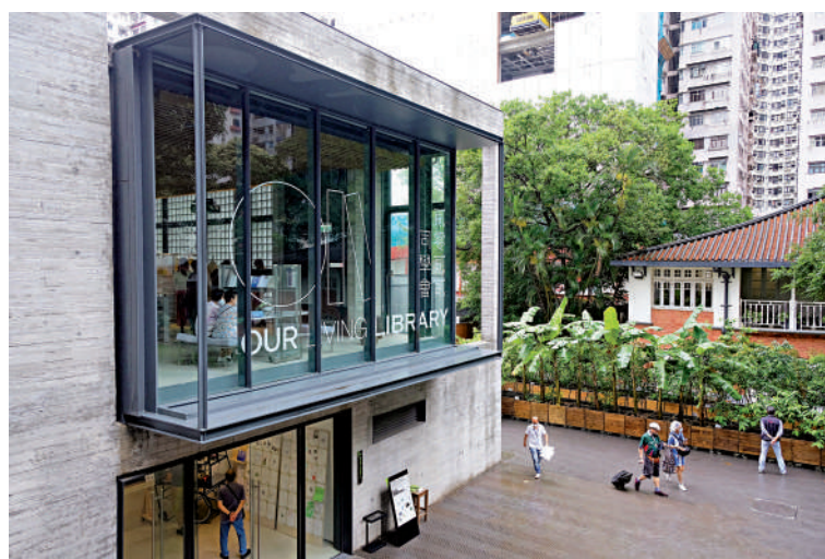
▲「貳零貳貳同學會」藝術空間。

政府設立支持「內容開發」的新資助機制，促進整個文創產業的跨界創作和互動；第三，文創產業的「硬件」方面，《報告》認為應該開發文化數據系統，搭建文化IP交易平台；最後在人才培育方面，《報告》希望政府能夠制訂清晰