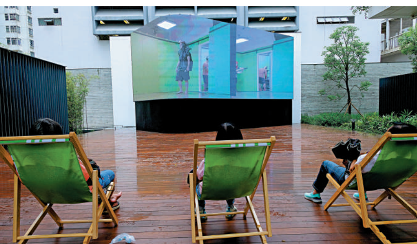
▲觀眾可坐在躺椅上欣賞「數碼繆思」。