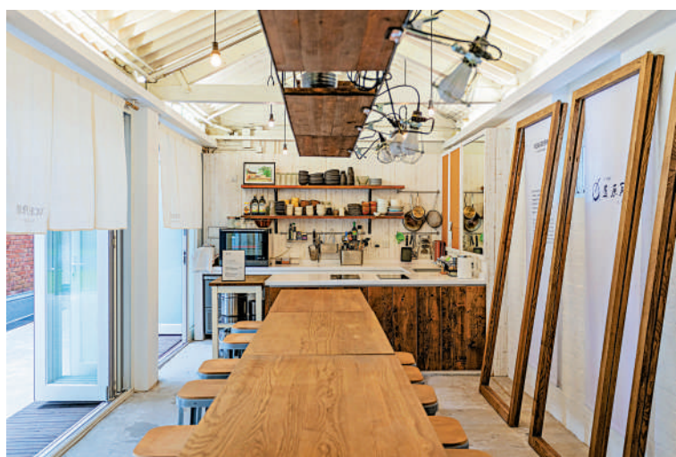
▲「XCHANGE」為生活空間提供創造力。

其他藝術項目還包括跨領域影像作品展覽「數碼繆思」、詮釋城市與自然共生關係的「未竟之園」、提供創造力想法的「XCHANGE」、推動城市種植的「人·樹·地」、以中國園林概念設計的「三假山」、戶外藝術作品《連里枝》和《綠野油蹤》，以及《油街星期天》等。