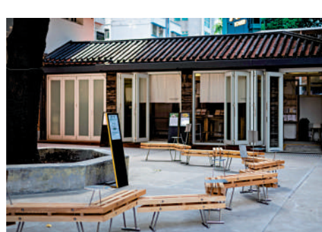
▲戶外藝術作品《連里枝》。