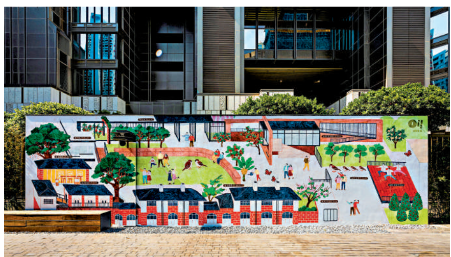
▲戶外藝術作品《綠野油蹤》。