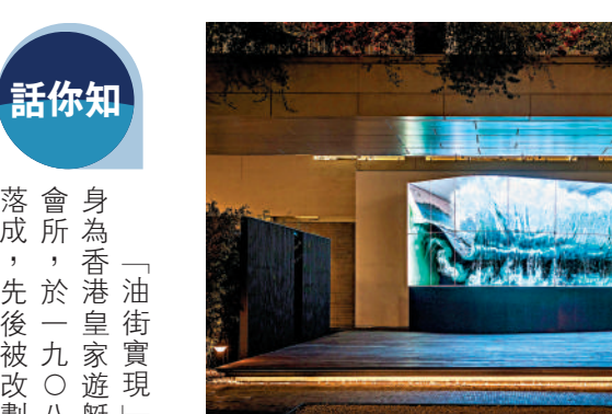
▲數碼藝術展覽「新域混影」。

香港政府物料供應處員工宿舍，及古物古蹟辦事處的考古貯存倉庫。及後在藝術推廣辦事處籌劃下，將這所擁有紅磚瓦頂的二級歷史建築活化修復，並於二〇一三年改名為「油街實現」，作為藝術空間開放予公眾。隨後於二〇一九年進行擴展計劃，與毗連逾三千平方米的戶外空間連合，如今正式啟用。