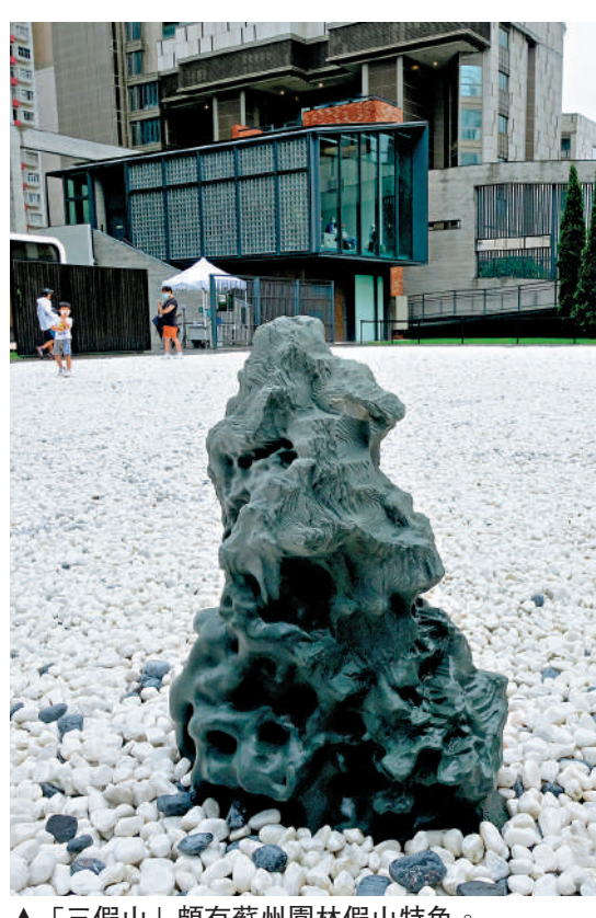
▲「三假山」頗有蘇州園林假山特色。