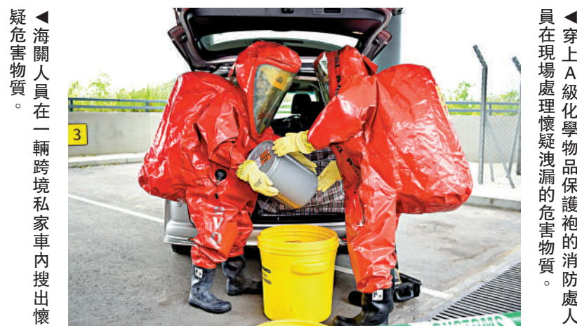
海關人員在一輛跨境私家車內搜出懷疑危害物質。