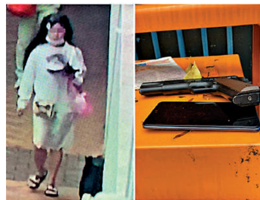
一名女子涉嫌在旺角警署閘門遺下氣槍和電話，被警方拘捕。

仍有激進黑暴分子死心不息，將公屋闖作實驗室自製炸彈，並在網上狂言要傷害警察及司法人員，企圖發動恐怖襲擊。