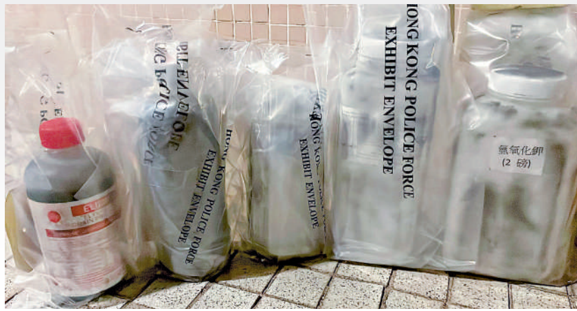
警方在東頭邨一單位檢獲一批爆炸品及製作工具，懷疑現場是製造爆炸品的小型實驗室。