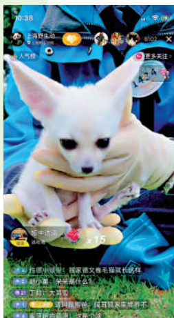
▲直播間小動物融化粉絲的心。圖為園內闖耳狐。

養小動物的，對於小動物的話題很感興趣，尤其喜歡熊貓，在上海封控期間，我關注了上海市野生動物園，看到動物們和保育員們快樂相處，我也感到很开心，有助於緩解關在家裏的煩悶。」