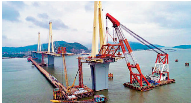
▲澳門輕軌規劃經橫琴口岸對接廣珠城軌延長線珠機城軌，圖為珠機城軌二期加速建設。

作為國家「八縱八橫」高鐵主通道之一，廣珠澳高鐵起自廣州北站，經廣州白雲機場、魚珠、南沙、中山、珠海鶴洲，終至橫琴口岸，設計時速達350公里。其中，鶴洲至橫琴段投資估算超126億元人民幣，擬於今年底開工。此線路通過橫琴口岸連通澳門，將進一步擴大澳門與內地交流，補強廣珠澳主軸交通運輸體系。此外，《規劃》還規劃研究澳門輕軌西線在關閘、青茂口岸設站，可望對接口岸一側的廣珠城軌珠海站。