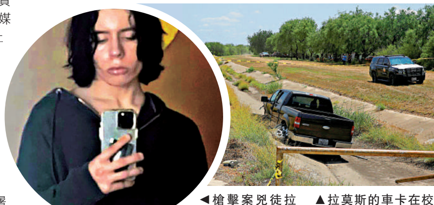
▲拉莫斯的車卡在校外溝渠裏。