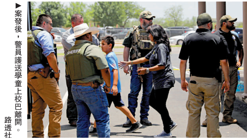
▶案發後，警員護送學童上校巴離開。