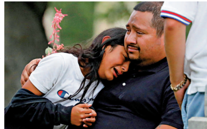
▶疑似遇難者的親友相擁而泣。