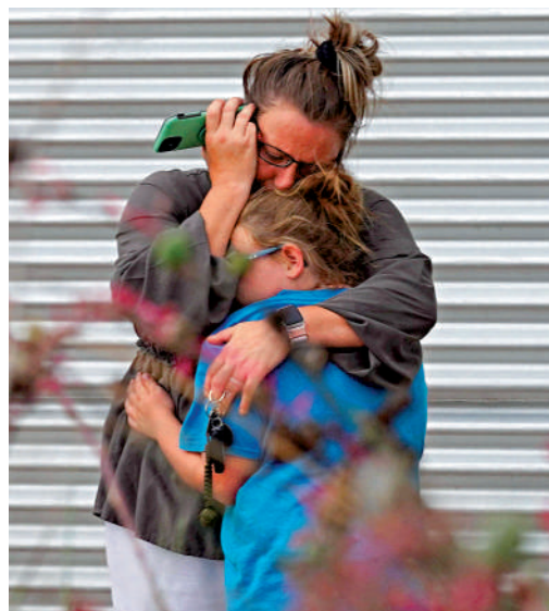
▲一名摟着小孩的婦女一邊打電話，一邊哭泣。