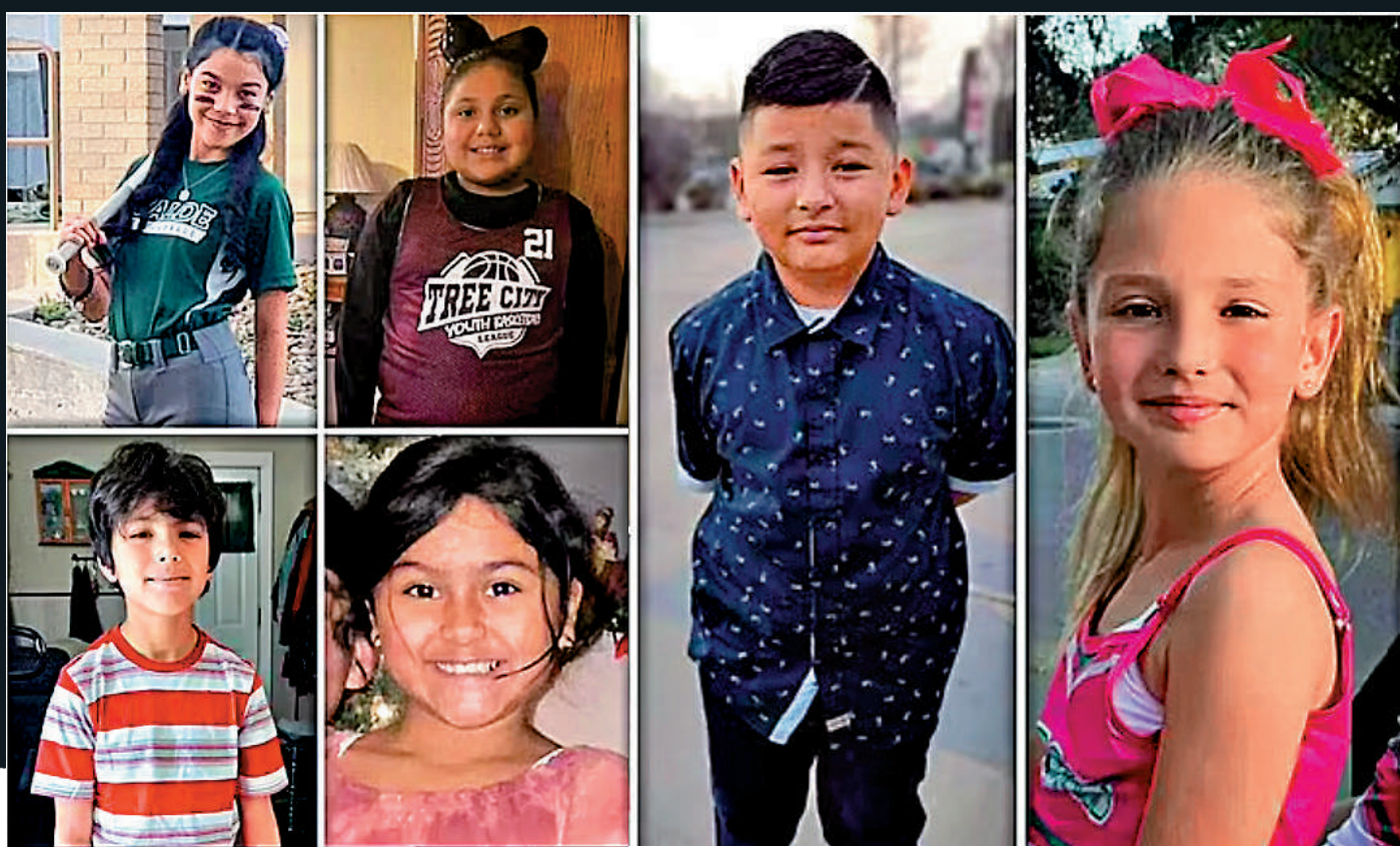
◀得州羅布小學19名學生24日遇難，圖為部分遇難者。網絡圖片

【大公報訊】綜合《紐約時報》、美聯社、商業內幕網站報導：美國得州南部尤瓦爾迪市一所小學24日發生槍擊案，造成一個班級內至少19名11歲以下的兒童和2名教師死亡，18歲槍手隨後被執法人員擊斃。這是繼2012年桑迪胡克小學槍擊案後，美國最致命的校園槍擊案。槍手在18歲生日當天購槍，並曾在網上預告施襲。