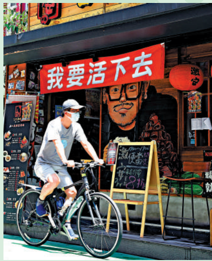
▲台北市東區一家餐廳掛出布條「我要活下去」，表達疫情下生意大減的無奈。

【大公報訊】據中通社報道：台灣本土餐飲、服飾業受新冠疫情爆發影響，業績衰退近3成，中國國民黨27日召開記者會指，疫情導致民眾自主減少外出消費，餐飲、服飾業者苦苦經營，急需當局直接紓困補助。