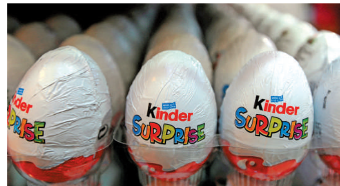
◀4月中旬，健達朱古力因沙門氏菌污染被大量回收。