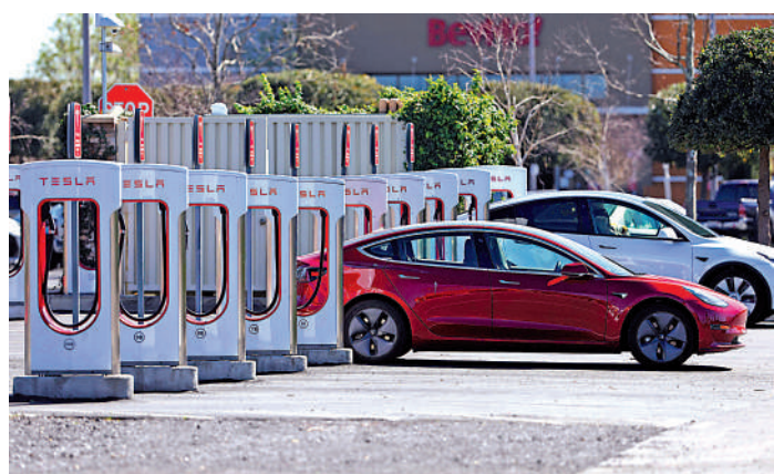
▲特斯拉計劃在荷里活開設帶有充電樁的汽車餐廳。

馬斯克一直以來擅長跨界做生意，除了眾所周知SpaceX和計劃要收購的推特，還做過銷售「特斯蘭」酒、空酒瓶、短褲等周邊產品，或許是馬斯克和特斯拉的號召力，每款產品都受到大量消費者追捧。