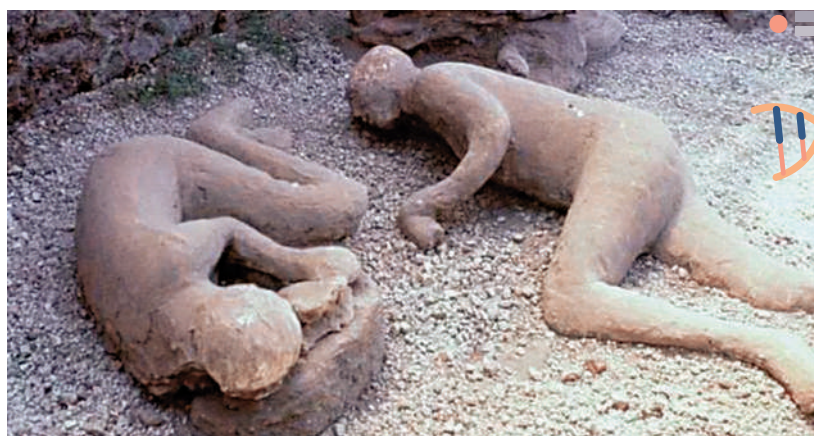
◀科學家成功從龐貝古城兩具遺骸中提取全部基因序列。

上述研究26日在英國《科學報告》期刊上發表，結果證明了從龐貝殘骸恢復古DNA的可能性，也有助了解遇難者生前生活。意大利薩蘭托大學的人類學家維瓦說，龐貝遺骸是「珍貴的寶藏」，「是世界上最著名歷史事件的沉默證人。」