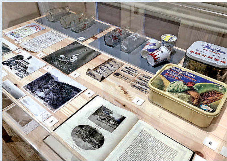
▲主樓有小型展覽，展示昔日雪糕杯、厚玻璃牛奶樽、舊照片等。