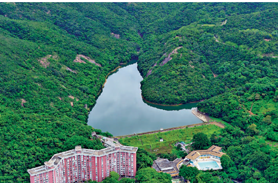
▲位於薄扶林郊野公園的薄扶林水塘。

薄扶林附近的瀑布灣，是昔日《新安縣志》譽為「鼉洋飛瀑」的「新安八景」之一，當時途經香港的船舶都在此取水補給。早年殖民地政府、外國商人和教會在薄扶林修建的建築物如杜格拉斯堡（現為香港大學大學堂）、伯大尼修院（現為香港演藝學院分校舍）等，這些都見證了香港開埠初期的發展。此外，距離牧場乘車約5分鐘（步行約30分鐘）的數碼港，是港島看日落熱點，這裏可以見到港島西邊以及鋼綫灣一帶的景色。數碼港海濱公園裏有一片大草地，不少人會在這裏野餐、放狗、放風箏等。長廊兩旁的樹木迎風搖曳，毛孩在大草地上跑跳，遊人坐在木椅上放空，待夕陽西下，靜看海上日落，優哉游哉。