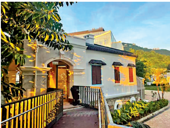
▲薄鳧林牧場主樓外的L形斜道。

早於清嘉慶年間的《新安縣志》（1819）便有「薄鳧林」一名。薄鳧林即現時港島的薄扶林，這個名稱是如何產生的，又為何與現時有所不同？對於薄扶林這個地名，最普遍的解釋是源自飛鳥。該處的茂林修竹青藤，吸引大量名叫「薄鳧」（鳧：音扶）的鳥類聚居。鳧是野鴨，又叫鶩，是雁鴨科鳥類，生活及棲息在湖泊、沼澤中。唐代王勃《滕王閣序》駢文：「鶴汀鳧渚，窮島嶼之縈迴」，唐代溫庭筠《商山早行》詩：「因思杜陵夢，鳧雁滿迴塘。」當地村民稱此地為「薄鳧林」，由於鳧的寫法生僻，地名後來被寫成「薄扶林」，並沿用至今。