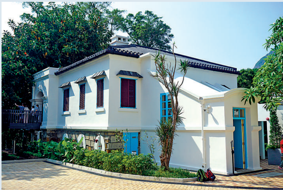
▲舊牛奶公司高級職員宿舍活化成為「薄鳧林牧場」。