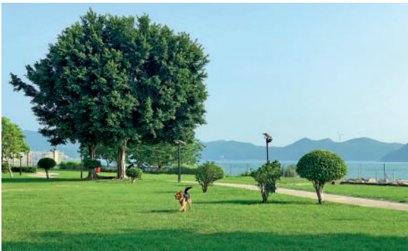
▲數碼港海濱公園的大草地面向大海，吸引不少人前往野餐、放狗、放風箏等。

除了參觀薄鳧林牧場外，大家還可到港島南區其他地方逛逛，認識附近的自然風光及故事，消磨大半天的時光。記者離開牧場過馬路往對面的薄扶林水塘道，順着薄扶林水塘道前行，經過薄扶林公眾騎術學校，約10分鐘抵達薄扶林水塘。薄扶林水塘建於1863年，蓄水量約23萬立方公尺，這亦是香港第一個水塘，在香港供水歷史上有重要地位。現時水塘內的四條石橋、量水站及前看守員房舍（現為郊野公園薄扶林管理站），都已獲評為法定古蹟。