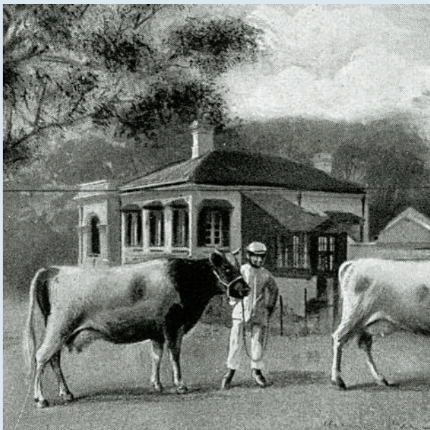
▲牛奶公司1919年出版的大事記中，刊有一幅相片可看到主樓外貌。