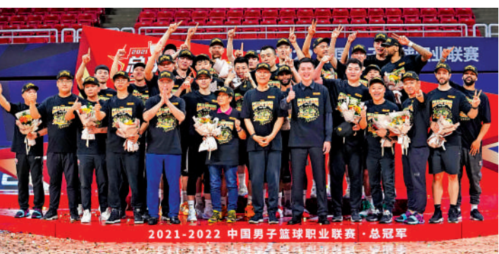
▲遼寧男籃時隔4年，再奪CBA總冠軍。

「賽季初我們就從北京找來了一個康復師加入保障團隊。聯賽第2階段結束的時候，我又聯繫了一個外籍的訓練師補充到球隊中來，他的很多訓練方法特別受球員們歡迎，不少主力球員都主動要求加入他的訓練。還有就是季後賽開始後，我們又臨時借調了福建的錄像分析師，他的到來也讓教練組的技戰術分析，有了更多數據支撐並做出正確的決策。」