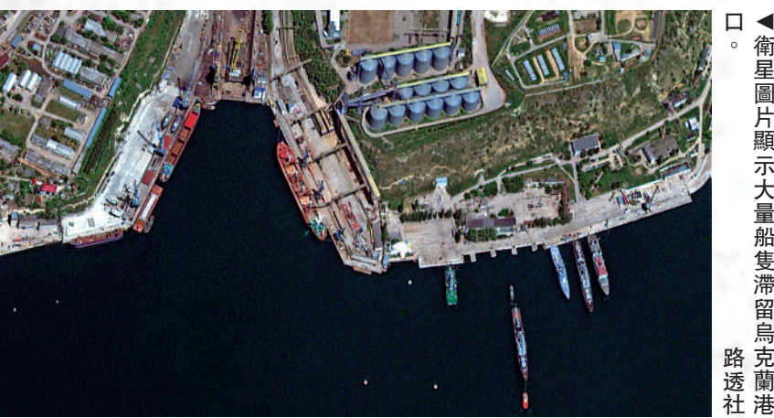
▲衛星圖片顯示大量船隻滯留烏克蘭港口。

保險公司除擔心船員人身安全，還擔心商務風險，運輸保險公司目前實際上拒絕為戰爭損失設保。由此，航運公司將貨物運往羅馬尼亞、摩爾多瓦、保加利亞甚至俄羅斯和格魯吉亞時，需自行承擔財政風險。