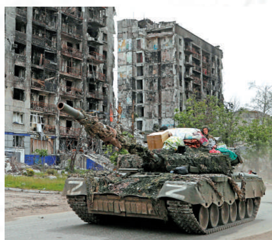
▲烏軍親俄民兵27日駕駛坦克在盧甘斯克地區巡邏。

另外，瑞典、芬蘭代表團與土耳其官員就北約擴員一事的磋商，沒有取得進展。由於土耳其方面反對，這兩個北歐國家申請加入北約一事遲遲未能展開。為尋求土方改變立場，兩國25日派出代表團，在土耳其首都安卡拉與土國官員舉行首輪磋商，時長約5個小時。土耳其稱多次向瑞典和芬蘭提出引渡庫爾德工人黨恐嫌的要求，但一直沒有得到兩國積極回應。北約秘書長斯托爾滕貝格27日表示，如果無法滿足土耳其的要求，瑞典和芬蘭兩國未必能在6月底北約馬德里峰會上正式成為北約候選國。