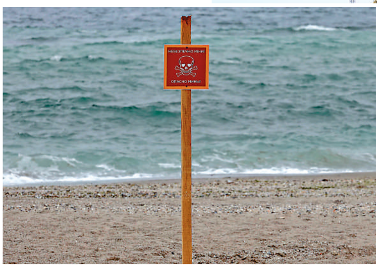
▲烏克蘭敖德薩海灘上的警告標誌上寫着「水雷危險」。

【大公報訊】綜合法新社、彭博社、半島電視台、德國之聲報導：俄烏衝突迄今超過三個月，烏克蘭的糧食出口受到了嚴重的影響，超過2000萬噸的糧食被滯留無法出港。在全球糧價飆漲、糧食供應出現危機的背景下，烏克蘭糧食出口之困，備受外界關注。分析認為，清除烏克蘭港口密布的水雷，耗時耗力，與俄羅斯合作是當前面臨的兩大主要挑戰。