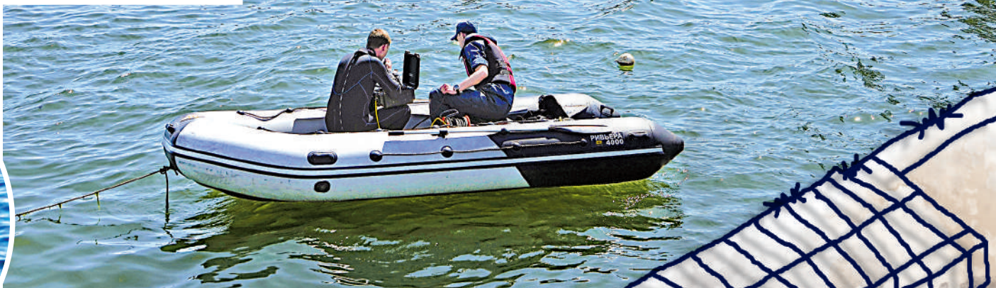
▲土耳其在黑海海域發現的水雷。 網絡圖片 ▲4月29日，頓涅茨克民兵在馬里烏波爾港口進行排雷工作。 美聯社

俄烏小麥出口佔到全球小麥出口量的1/3，烏克蘭98%的貨物通過海路運輸，穀物出口時間主要在3月到5月。受俄烏戰事影響，烏克蘭農業部近期表示，截至今年4月份，烏克蘭只出口了不到110萬噸糧食，遠低於正常水平，目前超過2000萬噸的糧食困於儲糧倉中。