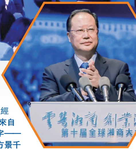
▲湖南省副書記、省長毛偉明在開幕式上致辭。