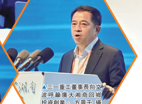
▲三一重工董事長向文波呼籲廣大湘商回鄉投資創業。

從古至今，湖南商人都是一股中堅力量。改革開放40餘年，湘商憑藉着一股「吃得苦、霸得蠻、耐得煩」的拚搏精神，演繹了從「一個包袱一把傘」到入圍全國工商聯統籌2021「創新中國」案例和四個「最具」榜單的商業傳奇。目前，全球湘商已超過400萬，產業遍布世界180多個國家和地區，在外湘商資產規模超過4萬億元。