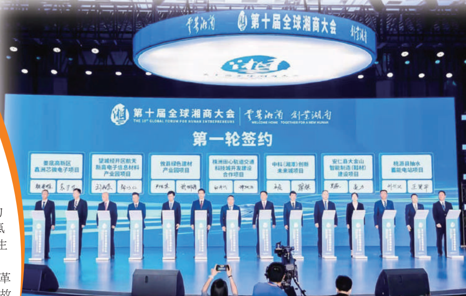
▲現場簽約。