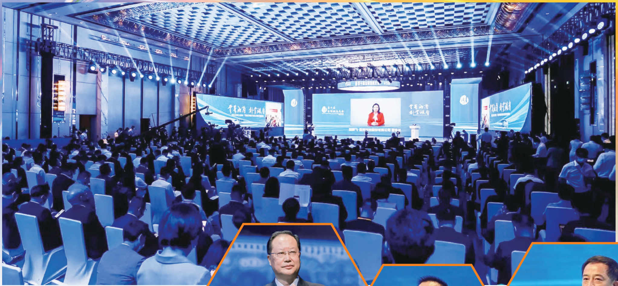
第十屆全球湘商大會現場。

5月23日上午，第十屆全球湘商大會在株洲拉開帷幕，第一屆「新湖南貢獻獎」的頒獎儀式成為了大會的高光時刻。