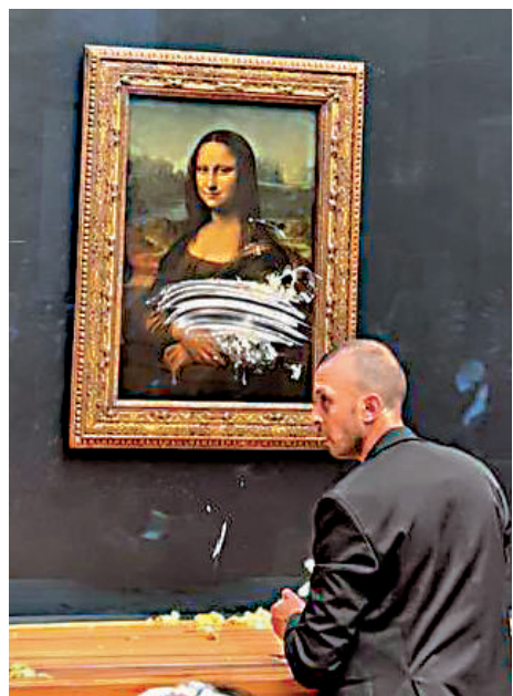
▲在法國羅浮宮展出的名畫《蒙娜麗莎》29日遭砸蛋糕。

【大公報訊】據法新社消息：當地時間29日在法國巴黎，一名男子喬裝成坐輪椅的老婦，突然向羅浮宮博物館的「鎮館之寶」世界名畫《蒙娜麗莎》砸奶油蛋糕，所幸畫作有玻璃板保護未受損壞。據報該名36歲男子是為了抗議藝術家們對環保的關注度不夠，他已經被捕並遭起訴。