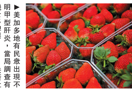
▲美加多地有民眾出現不明甲型肝炎，當局調查有機士多啤梨。

甲型肝炎病毒是一種傳染性病毒，在大多數情況下，它會導致輕微的病症，包括噁心、疲勞和腹痛。在極少數情況下，感染甲肝病毒會導致肝功能衰竭和死亡。近期，全球多地爆發不明原因兒童肝炎，共33個國家報告了650例兒童重症肝炎病例。目前尚不清楚此次甲型肝炎與不明兒童肝炎是否有關聯。