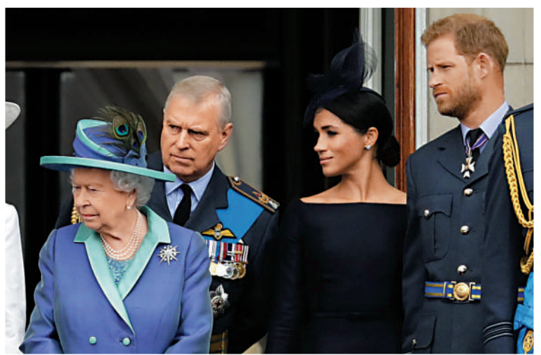
▲(左起)英國女王、安德魯王子、梅根及哈里王子2018年在白金漢宮陽台出席活動。