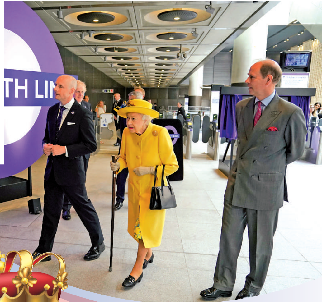
▲倫敦地鐵「伊麗莎白線」24日通車，圖為英國女王(中)17日在帕丁頓站出席慶祝儀式。

【大公報訊】綜合路透社、《衛報》、天空新聞報導：今年是英國女王伊麗莎白二世登基70周年(又稱「白金禧年」)。本周英國將連續4天舉行大型慶祝活動，包括閱兵式、教堂感恩儀式、街頭派對以及音樂會等。但與媒體的高調宣傳不同，民調顯示，有超過一半英國民眾表示對慶典不感興趣。有網民批評英國正面臨40年來最嚴重的通脹，但王室卻在此時大操大辦慶典，漠視百姓疾苦，令人失望。