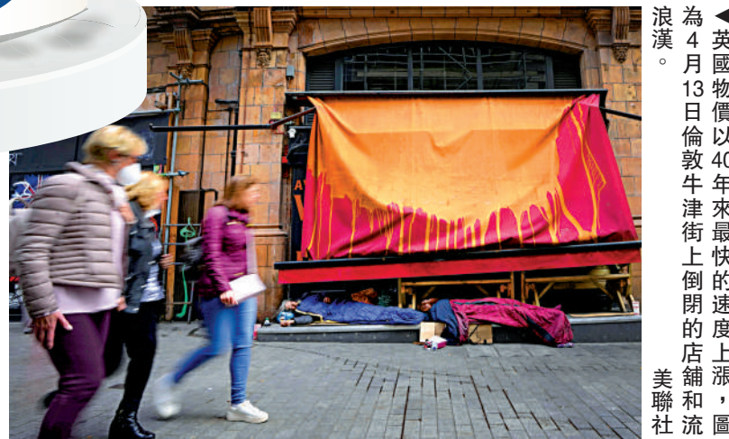
▲英國物價以40年來最快的速度上漲，浪瀟。圖為4月13日倫敦牛津街倒閉的店舖和流浪漢。

意大利藝術家達文西於1503年前後創作的《蒙娜麗莎》，是全球最著名的油畫之一，歷年吸引無數參觀者。這並非《蒙娜麗莎》首次遭到攻擊，1956年，曾有一名女子試圖朝這幅畫作潑硫酸，損毀其下半部分；數月後，一名玻利維亞男子曾向畫作投擲石塊，導致畫中蒙娜麗莎的左手肘顏料脫落。此後，羅浮宮加強安保，如今，蒙娜麗莎是世界上被保護得最好的藝術品之一。2009年，一位憤怒的俄羅斯婦女曾向《蒙娜麗莎》扔茶杯。杯子撞在玻璃上摔碎了，作品完好無損。