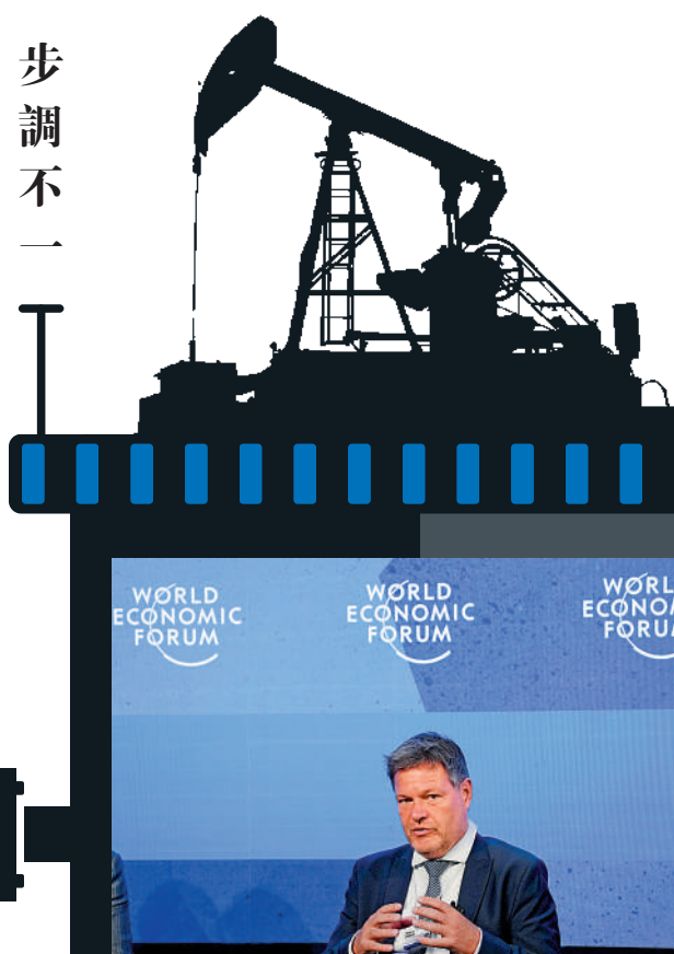
▲德國副總理兼經濟部長哈貝克29日感嘆歐盟因石油不再團結。