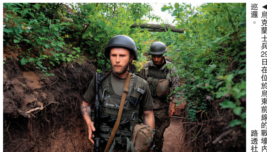
▲烏克蘭士兵29日在位於烏東前線的戰壕內巡邏。

西方媒體近期大肆炒作「俄總統普京病重」的未經證實信息。拉夫羅夫29日闢謠指，普京媒體都有公開活動，沒有任何患病跡象，「我希望那些散播謠言的人能摸着自己的良心說話。」