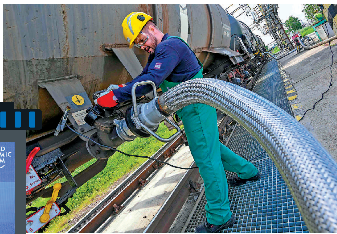
▲匈牙利高度依賴俄羅斯石油，圖為匈牙利煉油廠工人。