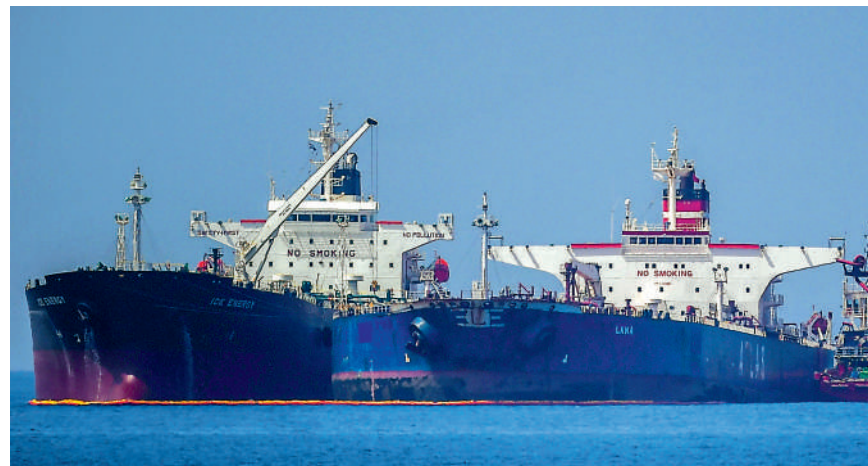
▲運送伊朗原油的「Lana」號（右）上月被希臘扣押，原油將被送到美國。

德國之聲指，今次事件與2019年伊朗和英國互扣油輪非常相似。當時英國先在直布羅陀附近扣押伊朗油輪，伊朗又扣押英國油輪作為報復。