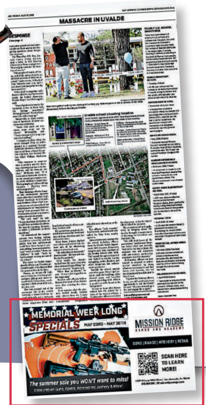
美媒在悼念得州遇難者的報道下方，放置槍支宣傳廣告。網絡圖片