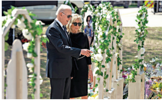
美國總統拜登夫婦29日出席槍擊案紀念活動，被現場民眾質問。

部門立法，禁止使用AR-15步槍等攻擊性武器。民主黨方面近日透露，得州槍擊案發生後，兩黨有望以合作方式推動國會出台減少槍支暴力的措施。但分析指出，美國前總統特朗普、得州參議員克魯茲及阿博特等主要共和黨人均明確表態反對控槍，雙方預計難達成實質控槍措施。白宮方面透露，拜登不太可能提出具體控槍提案或就槍支問題採取行政行動。