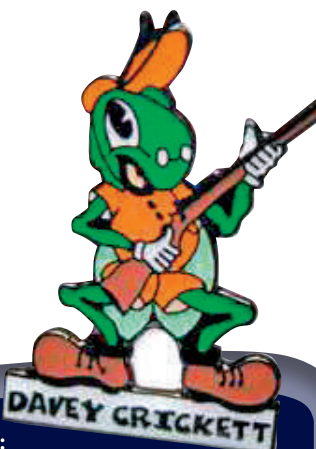
吸引兒童買槍的「戴維·克里克特」。

美國實用射擊協會（USPSA）利用暑假，招攬兒童參與射擊夏令營，還會定期帶他們到世界各地參加射擊比賽。