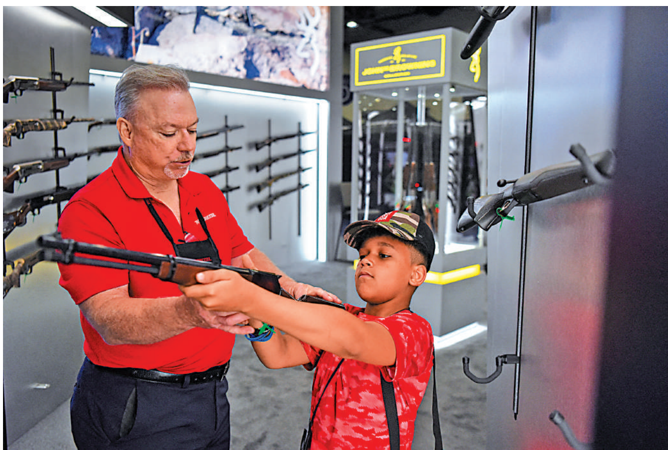
美槍支製造商為牟利，竟大力向兒童推銷槍支。