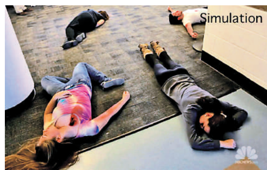
美媒指槍擊演習場面血腥，損害兒童心理健康。視頻截圖

蒙面人攜帶假槍闖入校園，扮演受害者的學生則渾身塗滿假血。一名學生家長說：「我在幼兒園的孩子在演習期間一個人被困在洗手間裏，之後花了一年時間治療焦慮。」