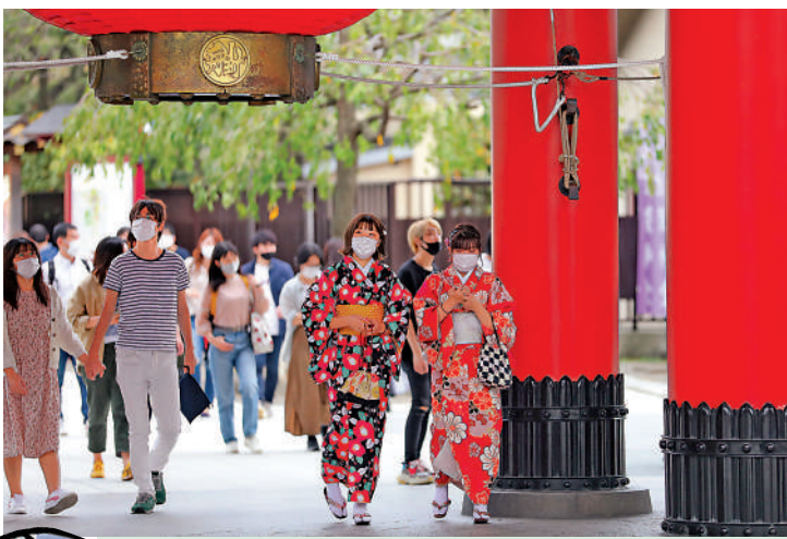
▲日本將開放外國旅行團入境，香港人到當地旅遊毋須檢測或隔離。

►多國放寬旅客入境限制，灣仔入境事務處總部有不少人續簽及領取護照，為出行作好準備。