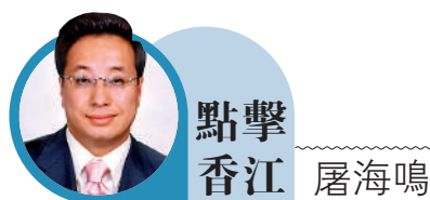
點擊 香江 屠海鳴

昨日下午，國家主席習近平會見了新任選委並獲中央政府任命的香港特別行政區第六任行政長官李家超。