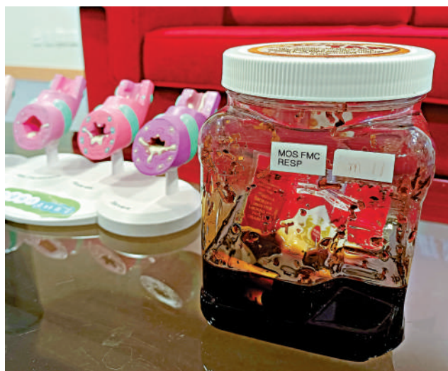
▲右側瓶內採集的樣品代表吸煙者每日吸半包煙，每年穿過肺部所累計的焦油量。