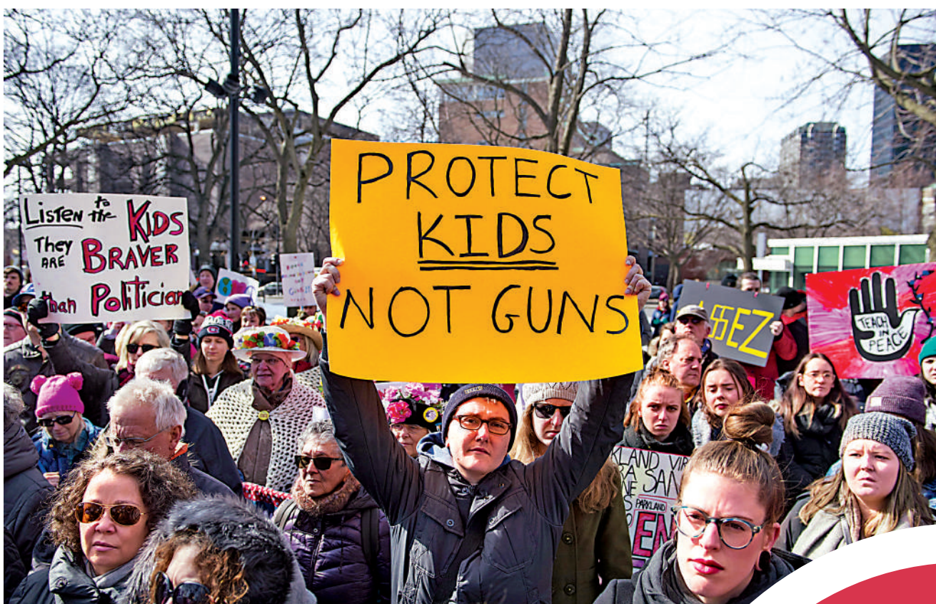
◀加拿大民眾高舉「保護兒童」標語，要求政府控槍。