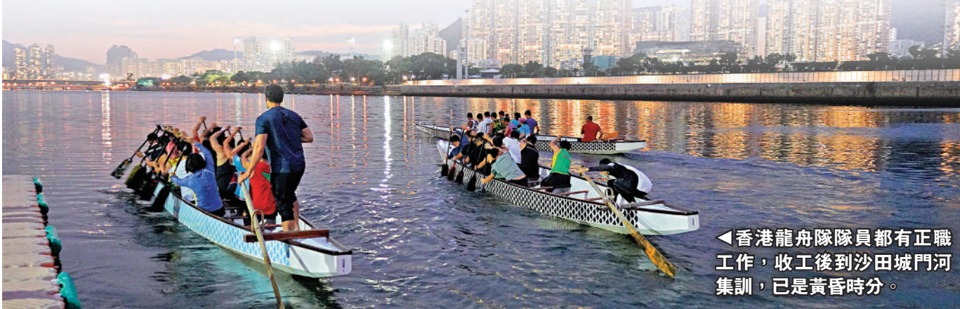
◀香港龍舟隊隊員都有正職工作，收工後到沙田城門河集訓，已是黃昏時分。

面對國內不少龍舟俱樂部對教練的渴求及較高的薪酬獎金，執意來港任教的伍教練深情說道：「香港是國際大都會，大家同飲珠江水，雖然龍舟水平同國內有差距，有較大的進步空間，如果能夠將港隊的整體水平提高，對我來講是最大的吸引力，這亦是我來港任教最想要的。」