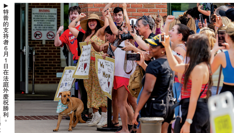
特普的支持者6月1日在法庭外慶祝勝利。

經過長達六周的審訊後，美國弗吉尼亞州地方法院5男2女組成的陪審團6月1日裁定，赫德2018年在《華盛頓郵報》撰寫的文章構成誹謗罪，特普獲賠1000萬美元補償性賠償和500萬美元懲罰性賠償。由於弗吉尼亞州法律規定，懲罰性賠償上限為35萬美元，而赫德在反訴官司中亦獲償200萬美元的補償性賠償，特普實際獲償為835萬美元。