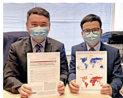
▲中大醫學院調查霍奇金淋巴瘤的全球分布，結果顯示香港男性發病率升幅是全球之冠。

淋巴瘤是香港十大常見的癌症，而霍奇金淋巴瘤在年輕人群較為常見。香港中文大學醫學院與環太平洋大學協會合作調查發現，亞洲地區的霍奇金淋巴瘤發病率呈明顯的上升趨勢，其中香港男性的發病率上升幅度更是全球最高。此外，霍奇金淋巴瘤發病率與人均國內生產總值 (GDP)、吸煙率、肥胖率及高血壓患病率呈正比。研究結果已於國際權威醫學期刊《Journal of Hematology & Oncology》發表。