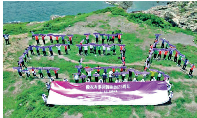
▲近百培僑師生在東龍島合力砌出 2、5、A (25th Anniversary 簡寫) 字樣，祝賀香港回歸 25 周年。

升旗後，近百位師生更合力堆砌出 2、5、A (25th Anniversary 簡寫) 字樣的隊形，以回應慶祝香港回歸 25 周年的活動主題。此外，參與活動的人士還向東龍島的居民和遊客派發減罪單張和防疫用品，希望提醒市民留意疫情和在郊野公園露營的風險。