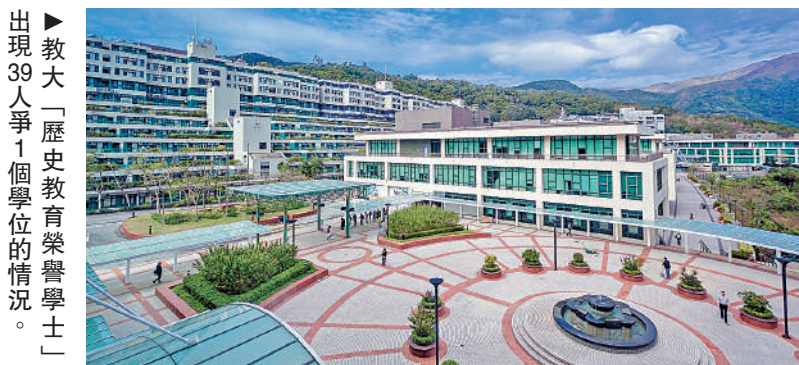
教大「歷史教育榮譽學士」出現39人爭1個學位的情況。

大學聯合招生辦法 (JUPAS) 終極改選，八間資助大學昨日公布聯招最新收生數字，而改選後以 Band A (首三志願) 申請人數計，最多報讀的是香港中文大學的「工商管理學士綜合課程」，共有 255 人報讀。競爭最激烈的學科同為中大的「文學士 (中國語文研究) 及教育學士 (中國語文教育)」出現 41 人爭 1 位的情況。兩個榜首均屬中大。