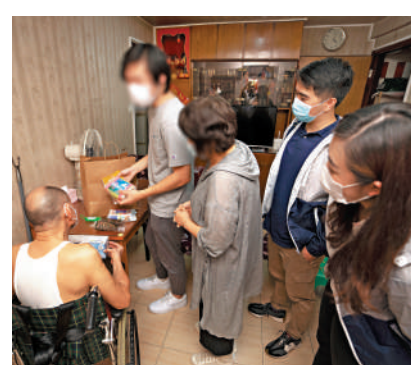
▲更生青少年與父母在灣仔探訪獨居及殘障長者。

是次活動既為青少年更生人士及其父母製造親子互動的機會，亦讓他們可以欣賞彼此的優點，建立互助互信的家庭關係，加強家人在更生路上的角色及更生人士的改過決心。兩個部門的工作人員在出發前，與青少年更生人士及其父母先將糴子、湯包、口罩、消毒酒精等物資包裝成「端午祝福包」，為登門探訪作好準備；其後欣賞端午節相關影片，加深他們對國家的歸屬感及歷史文化的認識。