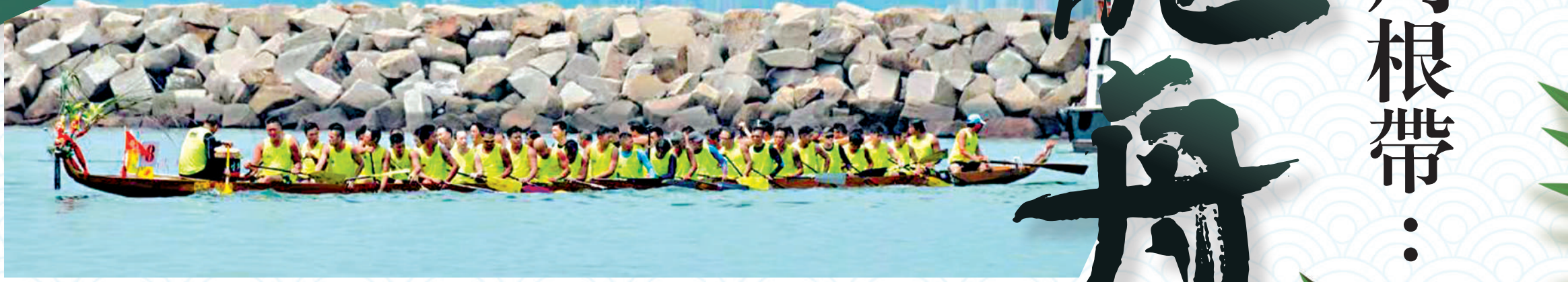
▲東區龍舟競渡大賽是東區一年一度的重要活動。

在香港，每年端午節各區都會舉辦不同的龍舟競渡比賽，鑼鼓喧天。龍舟作為一個歷史厚重、內涵豐富的傳統文化，如今以戶外運動的方式被很好地傳承了下來，受到愈來愈多年輕人的喜愛。能夠取得如今的影響力，其中過程離不開從花維路到周根帶這樣一代代港人的薪火相傳。