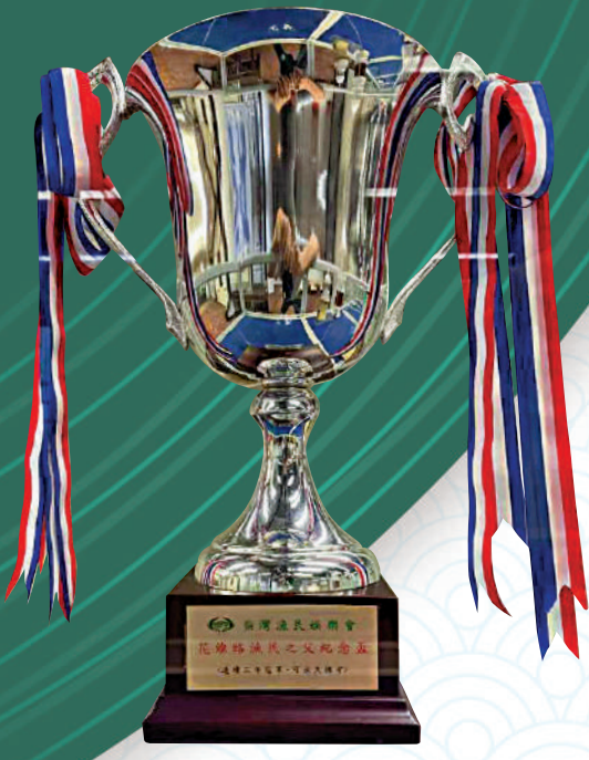
大公報記者 徐小惠、實習記者 丁蘊(文、圖)