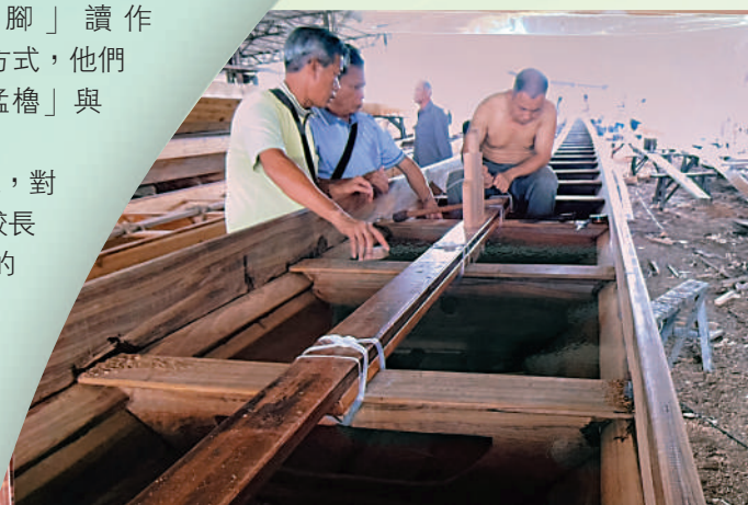
▲龍舟造價不菲，存放空間不足也是一個問題。

過去，漁民如果到岸上與人交流，對方一旦語速過快，他們就可能需要較長的時間去反應語義；如今上岸以後的水上人已經漸漸融入了岸上人的生活與語言習慣，水上人的後代已與岸上人難以區分。老一輩的水上人雖仍保留講水上話的習慣，但因沒有讀過書，多是文盲，因而難以將這個水上方言和傳統以文字形式保留下去。