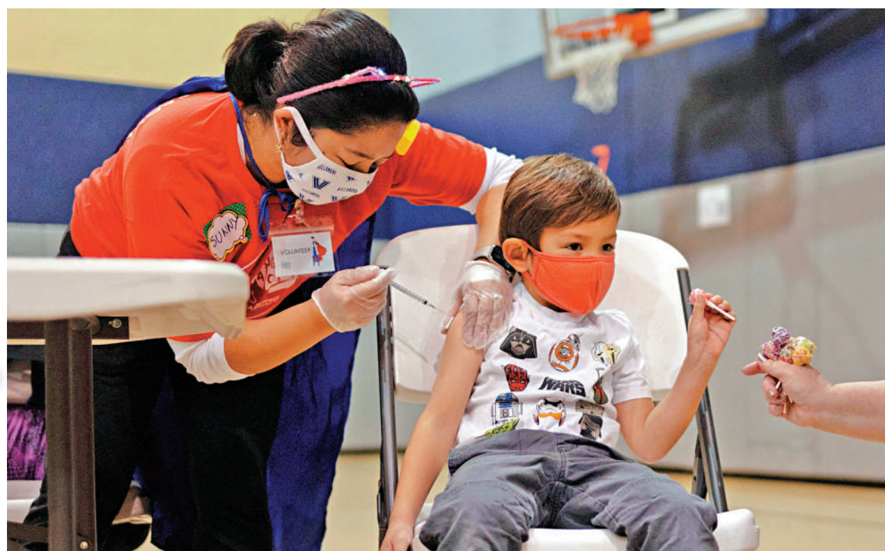
▲美國監管機構將於6月中審批5歲以下新冠疫苗,圖為賓夕法尼亞州一名5歲兒童接種新冠疫苗。