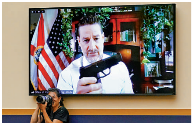
▲共和黨眾議員格雷格·斯圖貝在視頻會議時展示手槍。

白宮當天為悼念槍擊案遇難者點燃蠟燭。拜登當天在電視節目的黃金時段發表了演講。在20分鐘的講話中,拜登一共使用了12個「夠了」呼籲控槍,稱大規模槍擊事件已將美國學校和其他日常生活場所變成了「殺戮場」。