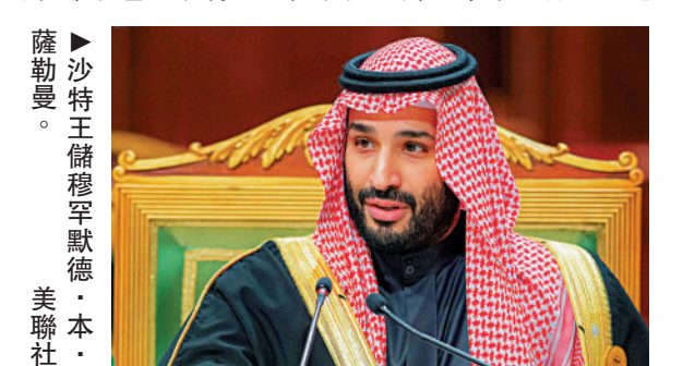
▲沙特王儲穆罕默德·本·薩勒曼。

白宮1日並未評論拜登是否訪問沙特。拜登已排定6月底將訪問歐洲。美聯社報道,拜登若前往沙特訪問,行程中將會晤沙特國王薩勒曼。拜登中東之行目的地可能也包含以色列。