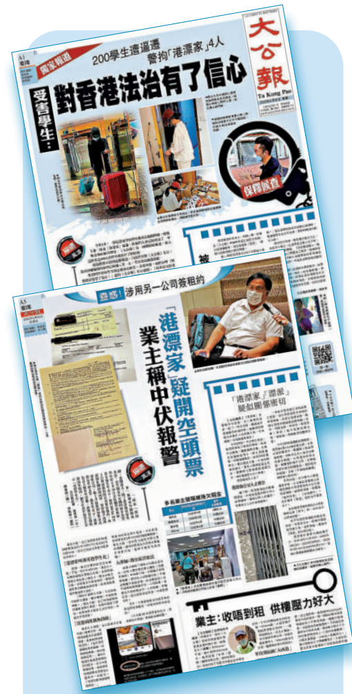
▲《大公報》連月報道港漂家租務糾紛，追查事件真相。