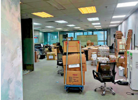
▲有同學上月到港漂家位於觀塘的辦公室，發現已沒有工作人員，只有疑似搬運公司的人正在搬運物件。

《大公報》記者之後再向伍、劉兩人詢問，300多名學生租客資料，究竟由誰掌控？雙方都否認在自己手上。