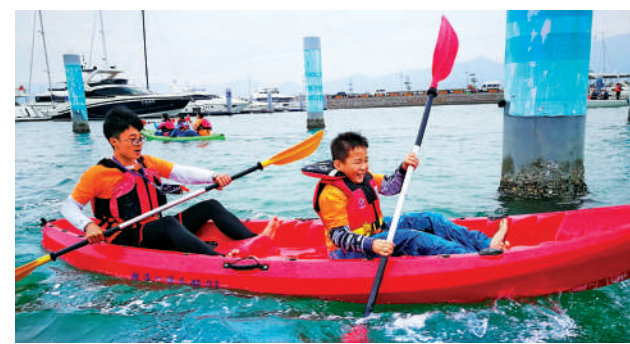
▲皮划艇運動也深受大朋友、小朋友喜愛。

搭配頭盔、馬甲、靴子，學習馬術似乎更加颯爽英姿；穿上擊劍服，拿起劍，酷炫的劍擊競賽才正式開啟；即便是室內滑雪，滑板、滑雪杖、滑雪服、手套、頭盔、護膝一個都不能少……逐漸成為社會主力的「Z世代」更加注重運動的特別性與高顏值，也使得大眾健身的方向發生了微妙的轉變。