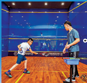
大公報記者胡永愛整理

在用牆壁圍起的場地內，按照一定的規則，用拍子互相擊打對手擊在牆壁上的反彈球的一項競技體育運動。球速快、運動量大，一個人就能打，在疫情下廣受歡迎。