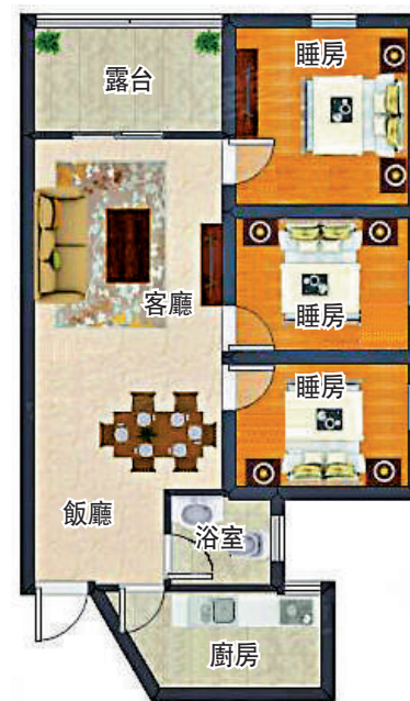
▲核電花園93平米的3房2廳戶型。