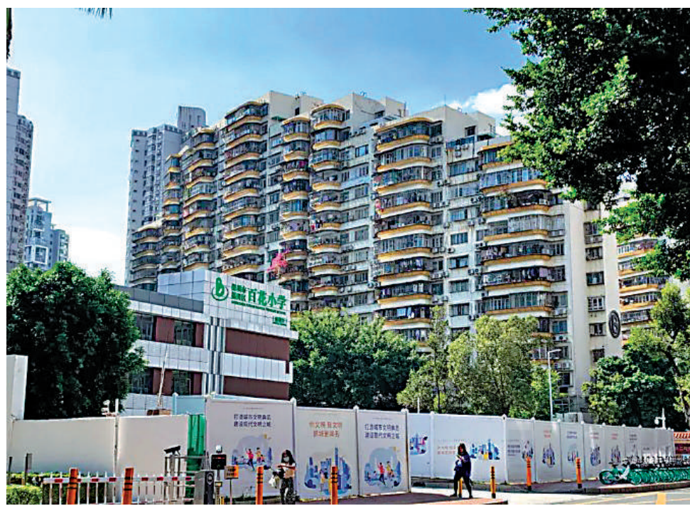
▲百花片區不僅名校雲集，且課外興趣班、補習班也是遍地開花。

「雞娃」是網絡流行詞，指的是父母為了孩子能讀好書、考出好成績，不斷給孩子安排各種學習和活動，讓孩子去拚搏的行為。百花片區位於深圳地鐵6號線體育中心站附近，屬於福田區園嶺街道，交通四通八達，環繞有地鐵1號線、3號線、6號線，片區離中國電子一條街華強北及深圳市委市政府大樓較近。