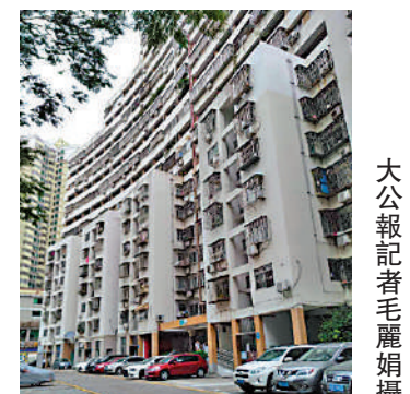
▲南天一花園外觀。