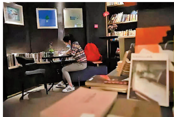
▲擁有超過20年歷史的物質生活書吧，是深圳最為知名的書店之一。

「如果不太在意小學學位，選擇百花小學及實驗學校初中的話，可以考慮購買長安花園的房子，目前一套在售的98平米3房戶型，政府指導