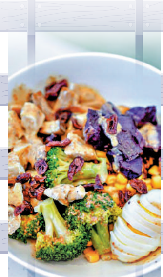
▲餐廳主推健康低卡的沙律、雜糧碗等餐食。

近年來，不少企業紛紛跨界做起了品牌，如同同仁堂做奶茶、中國郵政賣咖啡等，不管是傳統老牌企業還是新消費品牌，在進入市場之初都非常讓人驚艷。與此同時，如何保住客戶黏性，持久地贏得口碑才是關鍵。鐵路餐廳的工作人員告訴大公報，鐵路餐廳也將堅持做好「鐵路風」和優質餐飲的結合，爭取成為疫情之下，跨界旅行與餐飲的業界黑馬。