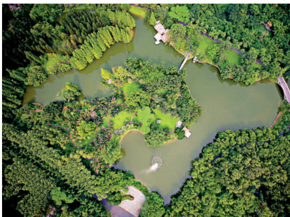
◀華南植物園堅持保護第一。圖為現有的中科院華南植物園園區。

《批覆》指出，華南國家植物園建設堅持人與自然和諧共生，尊重自然、保護第一、惠益分享；堅持以華南地區植物遷地保護為重點，體現國家代表性和社會公益性；堅持對植物類群系統收集、完整保存、高水平研究、可持續利用，統籌發揮多種功能作用；堅持將熱帶亞熱帶植物知識和嶺南園林文化融合展示，提升科普