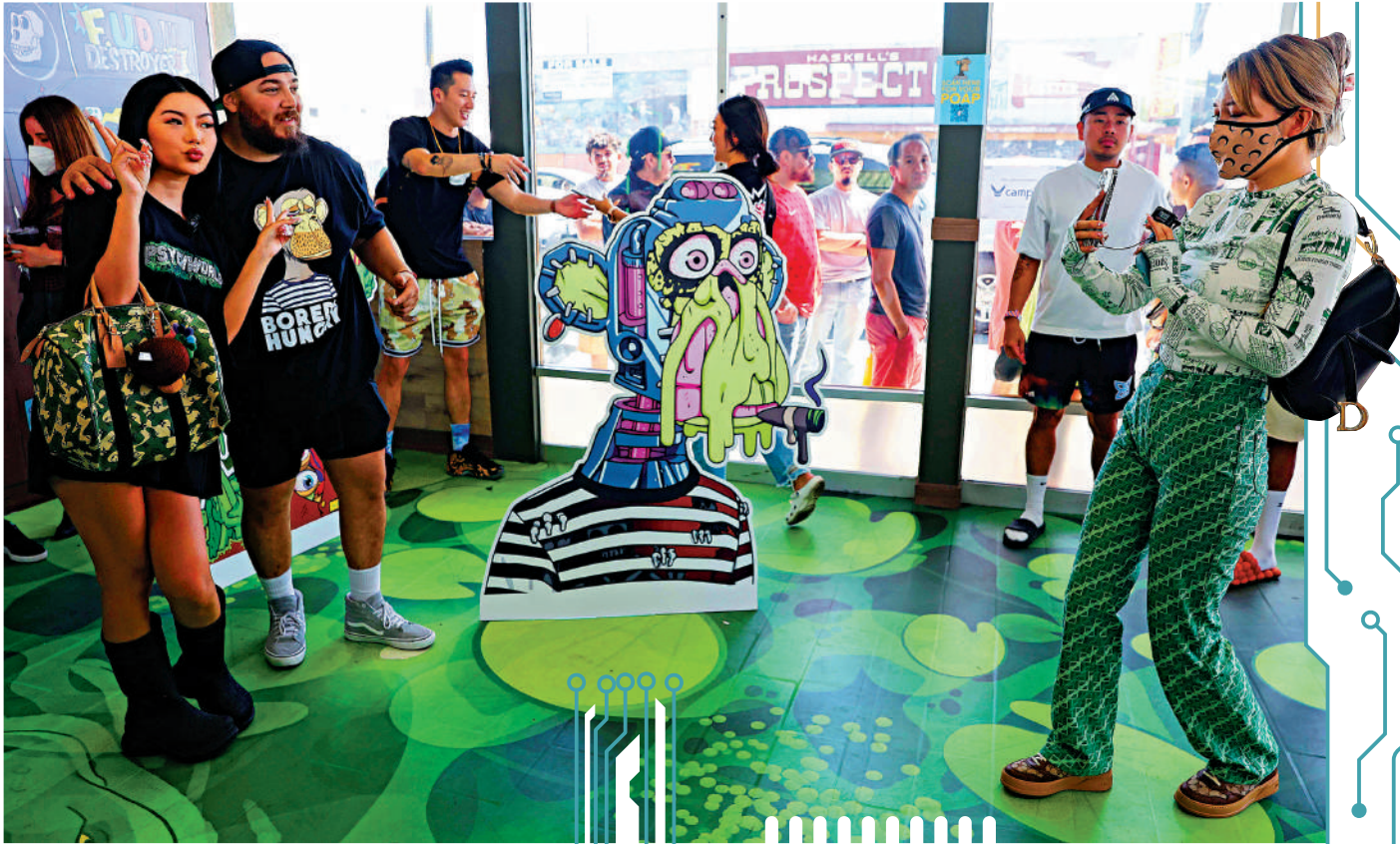
▲加州買家購入「無聊猿」後將其用作自家餐廳招牌，吸引大批食客。

《華爾街日報》5月3日發布報道稱「NFT市場正在崩潰」，該報道引述數據網站NonFungibl的統計資料顯示，NFT在5月第一周日均銷量下降到約1.9萬個，較去年9月份約22.5萬個峰值下降92%。報道分析，利率上升已經壓垮金融市場的高風險押注，而NFT是其中投機性最強的投資類別之一。