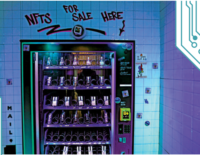
▲紐約街頭出現NFT自動售賣機，買家可使用信用卡付款。

2021年，數字藝術家Beeple創作的NFT作品《Everydays : The First 5000 Days》，在佳士得以6930萬美元的價格售出，創下NFT銷售紀錄。