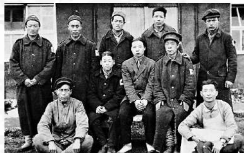
▲服務於廚房和醫院的華工們。

有天津、香港、青島、廣州等九個地方，其中香港的分公司更是設於中環的雲咸街。及後，英國和俄國也在1916年秋季先後在威海衛、濟南、東北等地設立招工所。至於第一次世界大戰中出洋華工的總人數有不同的說法，有的說是十幾萬，有的說是二十三萬，而根據《申報》1919年6月的報道，出洋華工是多達三十萬人。