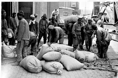
▲1917年在法國北部濱海布洛涅，中國勞工在英軍軍官的監督下將一袋袋的燕麥裝車。

當時法國與北洋政府組織了一間名為「惠民公司」的招工公司，中方代表由梁士詒擔任總經理，法國軍方則以陶履德上校以農學博士的名義代表工廠，並在1916年5月正式簽訂招工合同。而這間惠民公司招工的地點