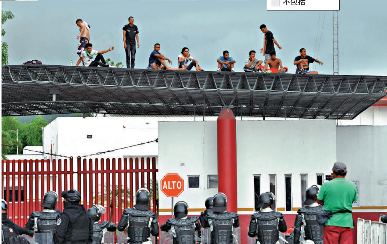
非法移民6日在墨西哥塔帕丘拉一個收容點與國民警衛隊對峙。

【大公報訊】綜合《紐約時報》、美聯社、CNN報道：第九屆美洲峰會於6月6日至10日在美國洛杉磯舉行。拜登政府原計劃藉此機會重置與拉美的關係，重申美國領導力，但從出席者名單到峰會議題均出現前所未有的混亂，墨西哥、烏拉圭等多國領導人缺席峰會，或派低級代表出席。分析指，美國打着所謂「民主」旗號，霸道決定誰出席峰會的做法不得人心，這暴露美國在拉地地區影響力正在下降。