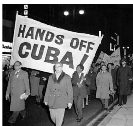
1962年10月，反核人士在倫敦抗議美國在古巴導彈危機中的舉措。資料圖片

【大公報訊】據路透社報道：俄烏戰爭仍在持續，美國源源不斷向烏克蘭送武器，刺激局勢不斷惡化。美媒稱，拜登政府原打算在此次美洲峰會上拉攏拉美國家，共同譴責俄羅斯。但隨著多個國家領導人拒絕出席，這一計劃難以實現。其實早在2月上旬，美國參議員桑德斯就批評美國過去200年一直奉行「門羅主義」，破壞和推翻了中美洲、拉丁美洲和加勒比海地區的至少十幾個國家政權。「如果和俄羅斯處在相同的境地，華府絕對會向烏克蘭下手」。