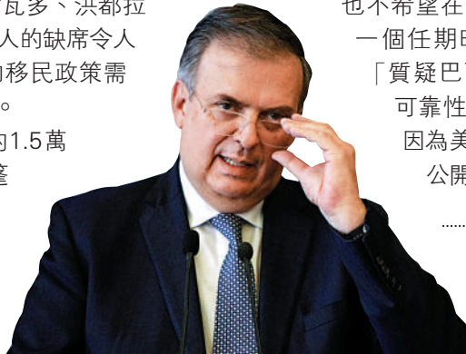
墨西哥外長埃布拉德代替總統出席峰會。

另一方面，美聯社引述巴西官員報道，巴西總統博索納羅雖然答應出席美洲峰會，但他是有條件的，只有拜登允許他進行私人會晤，並避免就兩人之間最具爭議的一些問題與其對峙，他才會出席。巴西將於10月舉行大選，博索納羅目前民調落後於前總統盧拉，他急需改善在選民心中的外交形象。博索納羅不希望受到任何批評，也不希望在他準備競選另一個任期時，有人對他「質疑巴西選舉制度的可靠性」提出警告，因為美方沒有被授權公開發言。