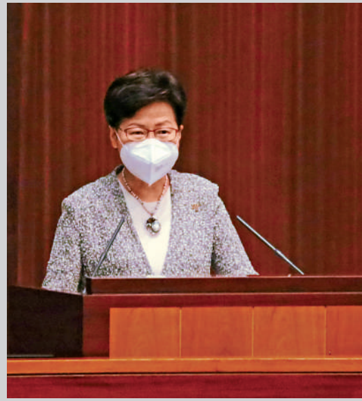
▲行政長官林鄭月娥昨日出席任內最後一次立法會行政長官答問會。

行政長官林鄭月娥昨日出席任內最後一次立法會行政長官答問會。她在開場發言時，形容過去五年的香港驚濤駭浪，出現前所未見的嚴峻挑戰。今年是香港回歸祖國25年，正站在返回「一國兩制」初心及正確軌道的新起點上，相信大家對香港的未來充滿期待。 林鄭表示，確保「愛國者治港」，政府官員將更有底氣。她又說，儘管社會對她的工作評價不一，但她自認已交出一張無愧於自己的成績表，為42年的公務生涯畫上完整句號。多名議員提問時對她任內工作表示讚賞與感謝，會議結束時全體起立向她致敬。