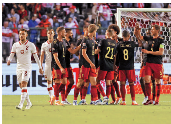
▲比利時 (黑衫) 大比數反勝波蘭。

另一仗荷蘭在補時4分鐘絕殺剛闖進世界盃的威爾士，連贏兩場作客後佔據榜首。阿特蘭大中場古普美拿斯的首個國際賽入球，助荷蘭於50分鐘打破僵局，雖然主隊在補時2分鐘由守將諾寧頓戴維斯扳平，但相隔約100秒後靠般尼前鋒韋格賀斯替荷蘭拿下最後勝利。