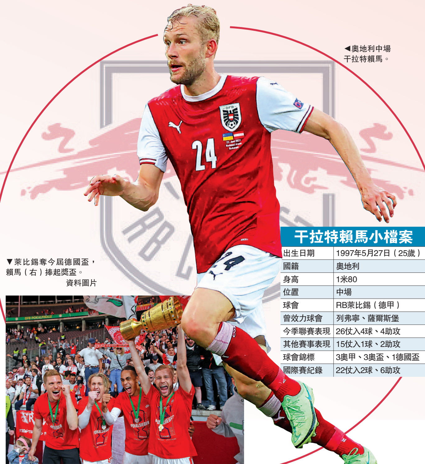
▲奧地利中場干拉特賴馬。