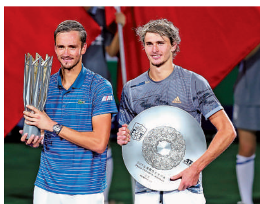
▲俄羅斯的梅拿迪夫（左）與德國的沙利夫是2019年上海大師賽冠軍、亞軍得主。

【大公報訊】據新華社報道：男子職業網球協會（ATP）9日宣布，作為全球九站之一，同時也是亞太地區唯一一站ATP最高級別1000分賽事，上海大師賽自2023年起將迎來升級，賽程將從原來的一周拉長至12天，單打籤表從56人擴容至96人，參賽陣容更為豪華，賽事獎金也將進一步提升，成為獎金最高的男子賽事之一。