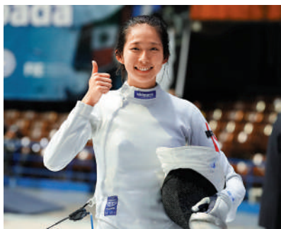
▲香港劍擊隊女子重劍名將江旻愷。