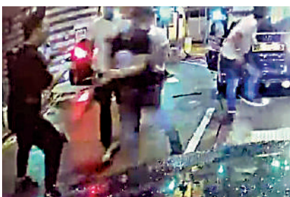
▲車卡片段拍得多名刀手包圍一輛七人車，車內疑有人開槍，刀手即四散（上圖），現場有人倒地（下圖）。

會兩派鬥爭，素有積怨，相信是兩派因非法利益分贓不均。案中一個幫派多人持刀施擊，另一幫派有人曾開至少兩槍。案件涉及五輛車，前三輛相信是來自第一個幫派的車輛，當時在雲咸街燈位前停下；後面來自第二個幫派的兩輛車，其中至少八人持刀由車上跳出，上前向第一幫派施襲。第一幫派其中一輛車踏油離去，其間撞倒人，餘下兩輛車有人向持刀施襲者開至少兩槍，其後逃去。