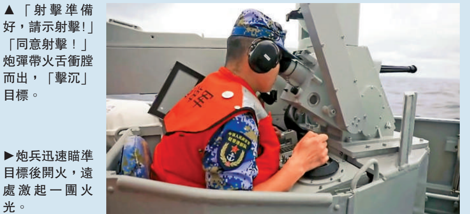
▲「射擊準備好，請示射擊！」「同意射擊！」炮彈帶火舌衝膛而出，「擊沉」目標。