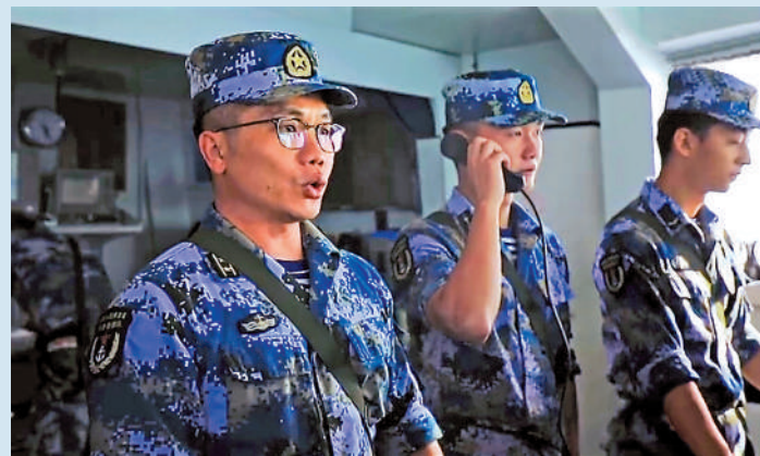
▲宿遷艦、荊門艦接報前方海域有「敵艦」活動，官兵迅速就位，鎖定目標開炮。