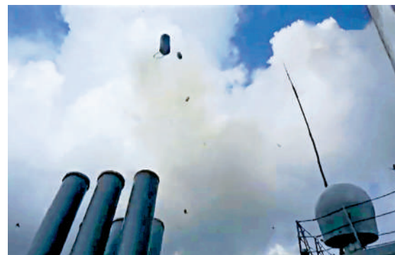
▲數枚干擾彈帶着尾焰升空，形成多道空中屏障，干擾來襲導彈。

海上航行一路，「敵情」如影隨形。連續五個晝夜的海上訓練，艦艇編隊緊盯實戰需求、堅持從嚴標準，構設多維域、多方向、多要素敵情威脅，連續開展對海作戰、防空反導、對岸火力支援、反恐反海盜等十多個實戰科目專攻精練，全面檢驗應對複雜戰場環境指揮處置和編隊協同能力。