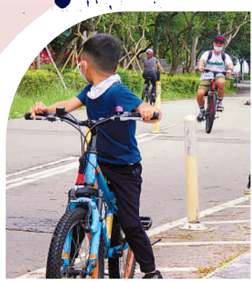
▲沒有戴任何安全裝備的小朋友，在假日的單車徑上馳騁。