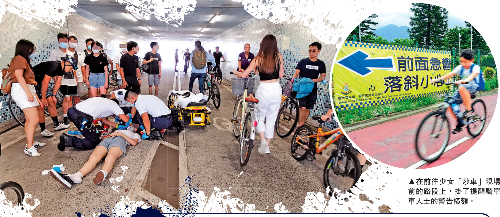
▲在前往少女「炒車」現場前的路段上，掛了提醒騎單車人士的警告橫額。