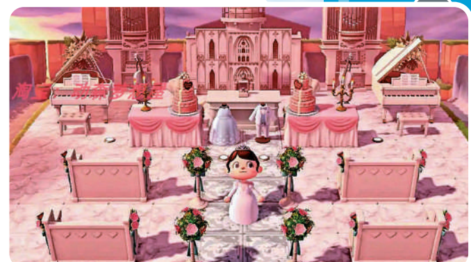
▲《集合啦！動物森友會》近期推出的婚禮主題內容頗吸引玩家。

動為時一個月，活動期間，玩家只要到訪巴獵島，就能幫遊戲角色莉詠和健兆拍攝特殊的結婚主題照片。拍完照能獲得莉詠贈與「愛的結晶」，這可用來兌換健兆製作的婚禮傢具，也能直接當作禮物贈送給住民。