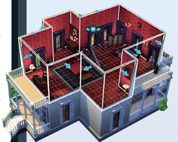
▲《模擬人生》系列是在一個模擬的世界中，仿造一個真實的情境。

一，它的火爆有很現實的原因。「通過將我們生活中最平凡的時刻——起床、上班、打掃房屋、培養關係——轉變成無數場電子戲劇，《模擬人生》徹底改變了遊戲。」這是App Store對模擬人生的評價，而《華盛頓郵報》的評價則是「如果你可以成為任何人，你想成為誰？20年來，《模擬人生》系列已經為億萬玩家解答了這個永恆的問題。」