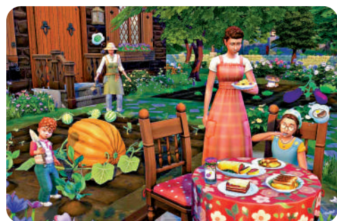
▲《模擬人生4》中的鄉居生活場景。