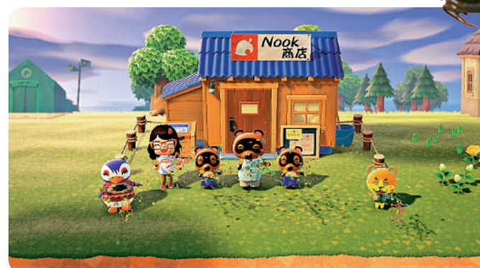
▲《集合啦！動物森友會》以卡通畫風為主。

讓人驚喜的是，《集合啦！動物森友會》經常會按照月份推出活動。「6月新娘」就是其中之一。這個活