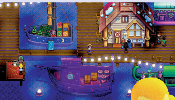
▲《星露谷物語》全平台遊戲銷售已突破2000萬套。

一款鄉村生活的模擬經營「養老」遊戲，有着清新自然的像素畫面。雖然是像素畫面，但觀感舒適養眼，細節上也十分到位。例如春天時空中飛舞的花瓣，夏天入夜後閃爍的螢火蟲，冬天降下的茫茫大雪。走在不同材質的地面上，也會發出不同的聲音。草叢裏躲藏的青蛙，路邊跑過的松鼠，這些塑造了一個栩栩如生的鄉村生活環境，讓玩家可以在遊戲裏體驗不一樣的人生。