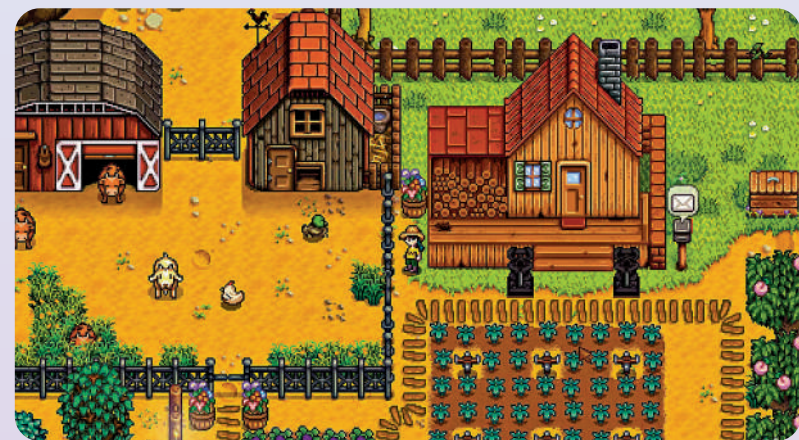
▲「像素風」是《星露谷物語》在畫面上最大的特點。

遊戲與20世紀90年代推出的牧場主題主機遊戲《牧場物語》系列在玩法和視覺上有相似。在遊戲開始時，玩家創建自己的角色，擁有一塊位於鵝湖鎮的土地，和其祖父曾擁有的小房子。玩家可以從幾種不同的農場地圖類型中進行選擇，每種類型都有其優點和缺點。農田最初被巨石、樹木、樹樁和雜草所淹沒，玩家必須努力清