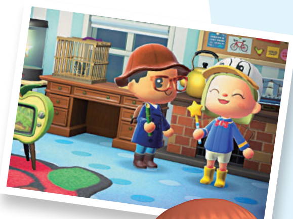
▲《集合啦！動物森友會》是任天堂Switch上的熱門遊戲之一。

《集合啦！動物森友會》在商業方面表現優秀，截至2021年底，本作的全球銷量已達至3864萬套，是目前任天堂Switch上賣的第二暢銷遊戲，僅次於《瑪力歐賽車8 豪華版》。以筆者的體驗來看，《集合啦！動物森友會》以卡通畫風為主，充滿了任天堂遊戲精緻而富有創造力的特質，因為只有主角一個「人」，其餘遊戲角色都以動物形象呈現，可愛無比。