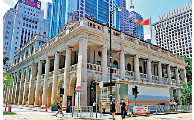
▲資深大律師制度對維護香港法治和司法公義有重大意義。圖為終審法院。