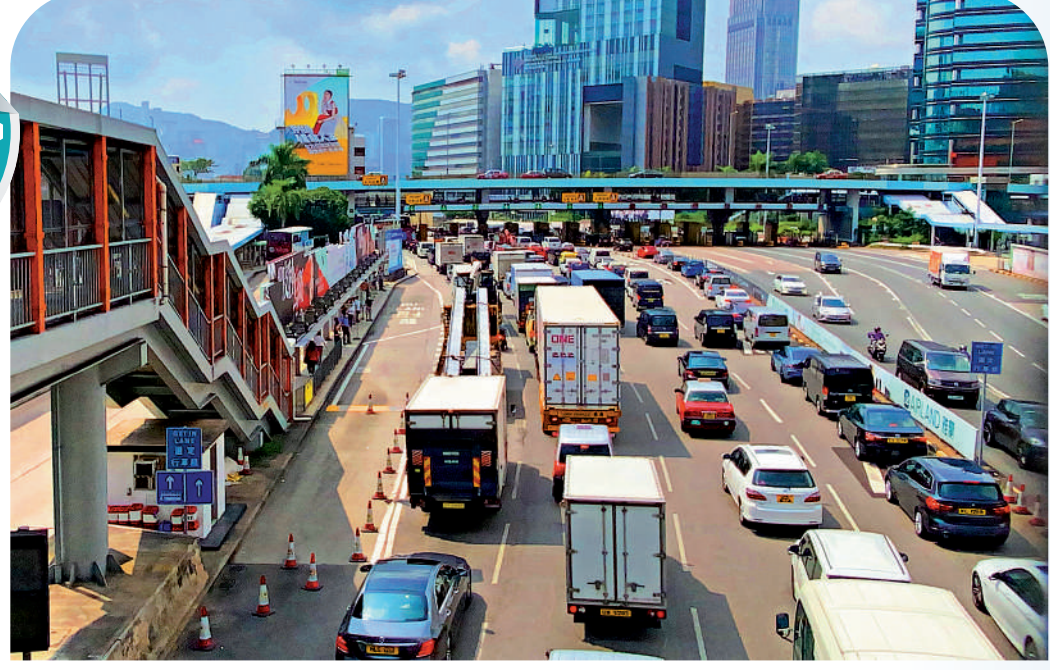
▲運房局局長陳帆表示，改革過海隧道收費的建議，將於本周五在立法會展開第一階段諮詢，局方聽取意見及評估影響後，會再制訂具體方案。

【大公報訊】昨日頭版報道政府計劃改革過海隧道收費，於繁忙時段額外徵收「塞車費」，非繁忙時段則可減費，鼓勵駕駛者使用公共交通出行，紓緩海隧擠塞問題。消息亦指收費計劃獲絕大部分立法會議員共識。 運房局局長陳帆昨日發表網誌指出，政府將於明年8月1日收回西隧專營權，考慮按整體過海交通情況把平日劃分為三個不同的收費時段，並於本周五（17日）在立法會展開第一階段諮詢，局方聽取意見及評估影響後，再制訂具體方案。