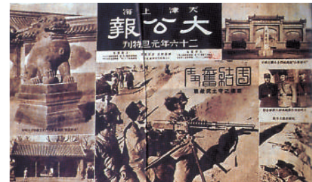
▲抗戰期間，《大公報》是抗戰輿論的中流砥柱。這是1937年元旦《大公報》上的抗日畫刊。

方漢奇認為，「文人論政」自古有之。所謂「文人論政」，就是知識分子以匡扶時世為己任，將「天下興亡，匹夫有責」的憂患意識貫穿到言論當中，力圖以言論來指引國家的走向，這是中國精英階層的優良傳統。不同時期不同階級的文人有不同的政治理想，但他們基本上都有着強烈的參與意識，都希望政治清明，國家富強。