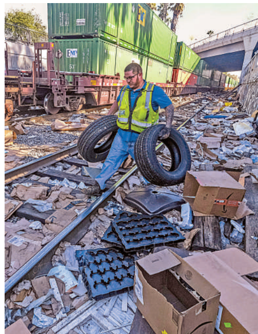
▲加州洛杉磯貨櫃被劫，承包商從被撕碎的箱子中回收汽車輪胎。