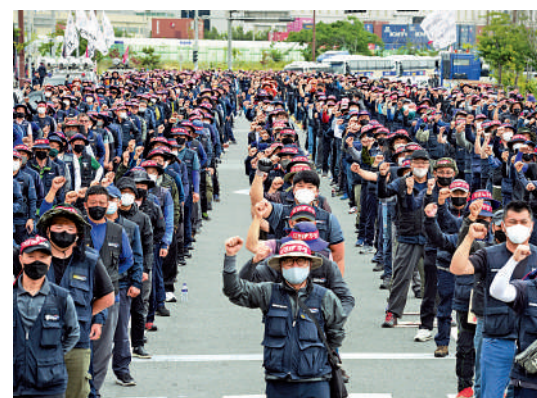
▲韓國蔚山的貨車司機13日舉行集會示威。

周的韓國總統尹錫悅帶來考驗，分散外界對其保守議程的注意力，並導致政府與工會長期對立。