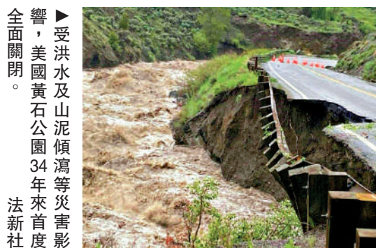
▲受洪水及山泥傾瀉等災害影響，美國黃石公園34年來首度全面關閉。法新社

【大公報訊】據法新社及路透社報導：美國黃石國家公園負責人表示，一場前所未有的暴雨引發了創紀錄的洪水和山泥傾瀉，當地時