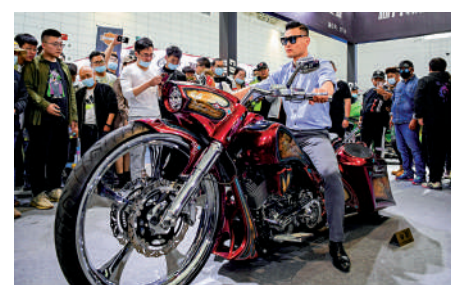
▲在去年舉辦的濟南國際摩托車博覽會上，觀眾試駕美國「柯瓦勒重機」摩托車。

的，澳方應該秉持相互尊重、互利共贏的原則處理兩國關係，同中方相向而行，推動中澳全面戰略夥伴關係健康穩定發展。