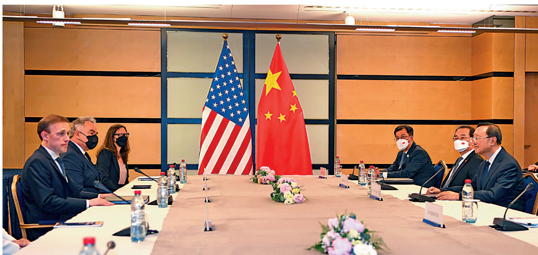
▲13日，中共中央政治局委員、中央外事工作委員會辦公室主任楊潔篪（右一）同美國總統國家安全事務助理沙利文（左一）在盧森堡舉行會晤。

【大公報訊】據新華社報道：當地時間6月13日，中共中央政治局委員、中央外事工作委員會辦公室主任楊潔篪同美國總統國家安全事務助理沙利文在盧森堡舉行會晤。楊潔篪表示，中美關係處在關鍵十字路口。中方堅決反對以競爭定義中美關係。他強調，台灣問題事關中美關係政治基礎，處理不好將產生顛覆性影響。美方應端正對華戰略認知，不要有任何誤判和幻想，必須恪守一個中國原則和中美三個聯合公報規定，必須慎重妥善處理涉台問題。