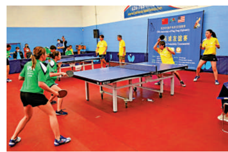
▲今年3月，紀念中美「乒乓外交」50周年友誼賽在美國加州洛杉磯舉行。

王勇接受大公報採訪時表示，中國之所以敢於劃出紅線，背後是中國不斷增強的軍事實力與綜合國力。他說，中國的實力已經不是十年前、二十年前的水平。他說，1995年美國單方面背信棄義，准許李登輝「訪美」，當年中國都敢於舉行大規模軍事演習進行反制，如