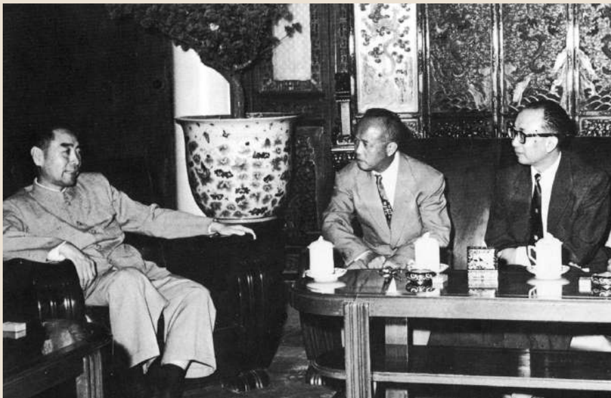
▲1956年，周恩來在北京會見《大公報》社長費彝民（右）及中華總商會會長許庇穀（中）。