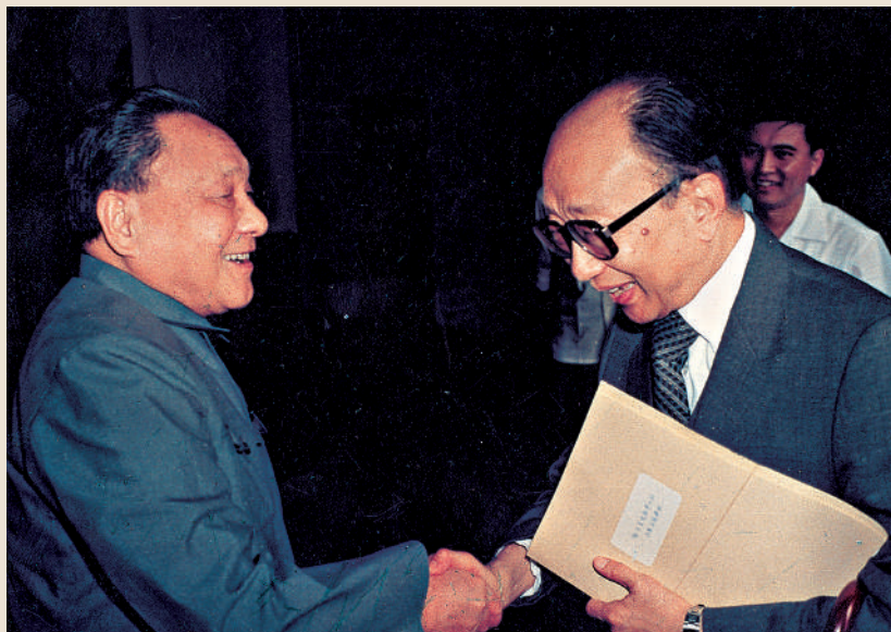
▲一九八二年，鄧小平會見《大公報》社長費彝民。