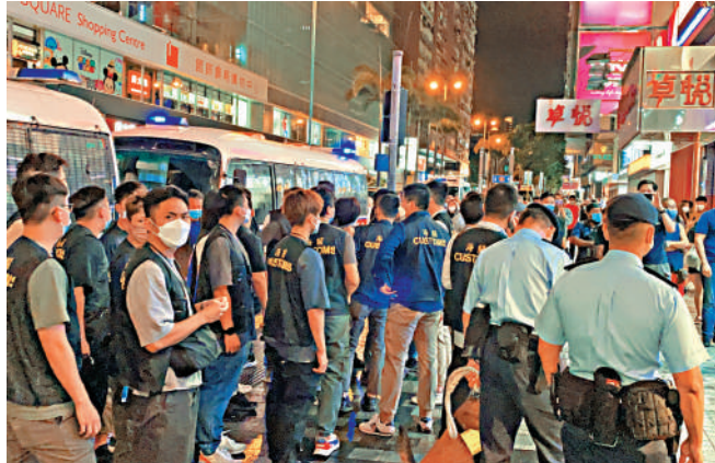
▲大批警方、海關、入境處人員抵達尖沙咀重慶大廈，展開巡查，追緝中環上周發生黑夜槍擊斬人案的槍手。

指，事主X因求愛不遂而誣衊被告的說法；並指被告理應選擇候判，但考慮其職業及關注病人利益，故按辯方要求讓他保釋處理公務。34歲被告妻子堅被控於2020年5月16日、17日及22日，在社交媒體平台Telegram群組發布淫褻物品，涉及事主X的兩張照片及兩段影片。