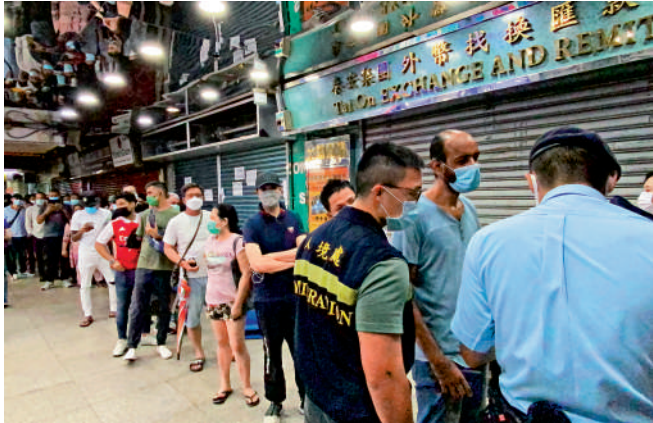
▲執法人員在重慶大廈一帶截查南亞裔人士證件，核實身份。