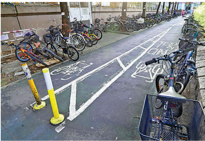
▲上水新運路港鐵站外的違泊單車佔據了單車徑，阻礙騎單車人士通過。

疫下「假日單車手」暴增，街頭湧現違泊，政府雖定期清理，但問題隨街亂泊仍然嚴重。大公報記者近日走訪多區，發現由新界到市中心區，多處欄杆都泊滿單車，在東鐵上水站更幾乎被違泊單車包圍。 有單車車主與議員建議政府增加「貨櫃屋」式泊位，同時加強清理掃蕩，解決問題。