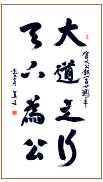
▲▲莫言為《大公報》創刊120周年題寫「大道之行，天下為公」。