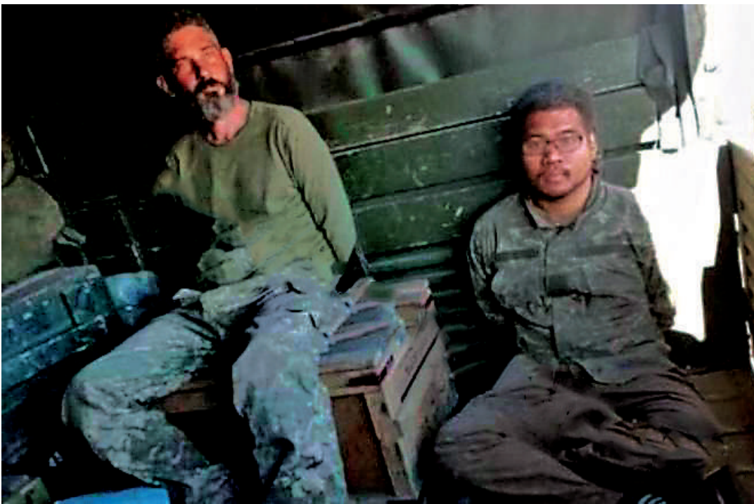
▲兩名美國僱傭兵在一輛軍用卡車上、雙手被綁的照片在網上流傳。

兩名英國僱傭兵和一名摩洛哥男子，早前在烏克蘭被俄軍擒獲，本月9日被頓涅茨克「最高法院」判處死刑。