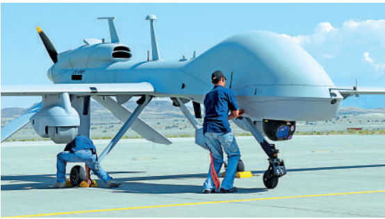
►「灰鷹」大型武裝無人機。

英國首相約翰遜17日突然再次到訪基輔，與烏總統澤連斯基舉行會談，稱將啟動「軍事訓練先鋒計劃」，預計每120天可向最多1萬名烏克蘭士兵提供訓練支持。英媒披露，約翰遜是在最後一刻決定缺席保守黨會議前往烏克蘭的，引發議員們不滿。約翰遜本月初剛在保守黨內對其進行的不信任投票中涉險過關。