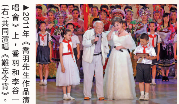
△2011年《喬羽先生作品演唱會》上，喬羽和李谷一（右）共同演唱《難忘今宵》。

得知喬羽因病逝世的消息後，多位歌星及演藝界人士紛紛發文悼念。《難忘今宵》的演唱者、歌唱家李谷一表示，自己從小就唱喬羽寫的歌，後來作為歌者還演唱了喬羽的很多作品。她和