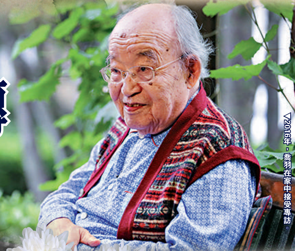
△2016年，喬羽在家中接受專訪。