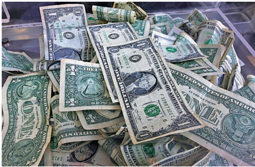
▲美國年內三度加息，累積加息1.5厘，儘管可說是為了壓抑通脹，然而美債同時成為跌市重災區，失去避險功能。

日本作為美國最大債主，4月減持139億美元的美債之後，持倉水平降至2020年1月以來最低，而作為美國第二大債主——中國，在4月持有美債倉位，亦大降362億美元，減持比重達到3.5%，令中國持有美債總額降至約1萬億美元，為12年來最低。