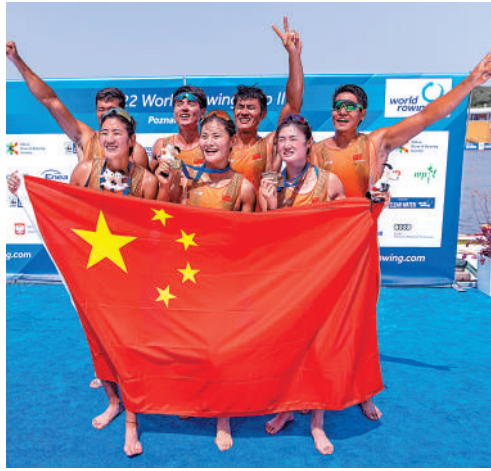
▲中國隊選手在頒獎儀式上合影。

在5月底進行的2022年賽艇世界盃首站塞爾維亞貝爾格萊德站比賽中，中國隊獲得1金4銀4銅，獲得金牌的男子四人雙槳是首次奪得世界盃冠軍。