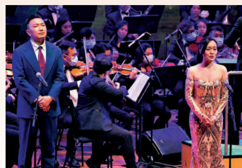
晚會節目十分精彩，現場氣氛熱烈。

全國政協常委、香港友好協進會會長唐英年表示，今年是香港回歸25周年，亦是香港友好協進會成立33周年，友好協進會將堅決支持新一屆特區政府施政。