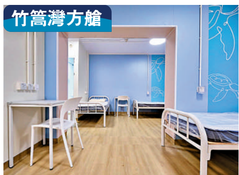
竹篙灣方艙及啟德方艙合共提供約一萬個房間昨日交付，標誌着中央援港防疫項目全部完成。

竹篙灣社區隔離設施每棟樓高兩層，啟德社區隔離設施每棟樓高四層並設有升降機，每個單位設有獨立廁所和浴室。